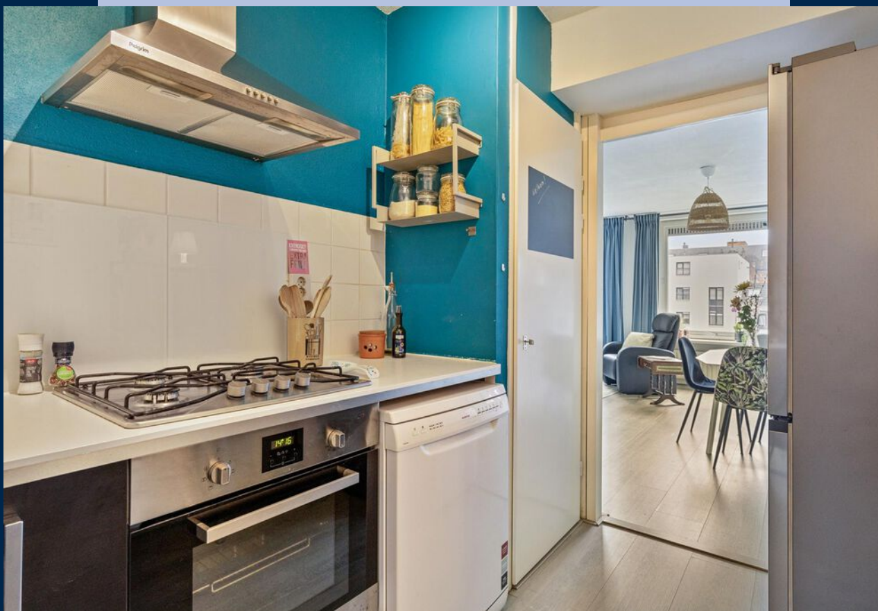
De half open keuken heeft een 4-pits gasfornuis, afzuigkap, inbouw oven (2023) en vaatwasser.