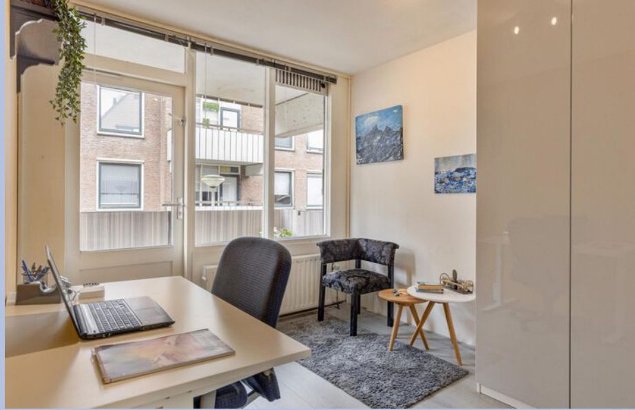
De ruime slaap/werkkamer geeft toegang tot het balkon.