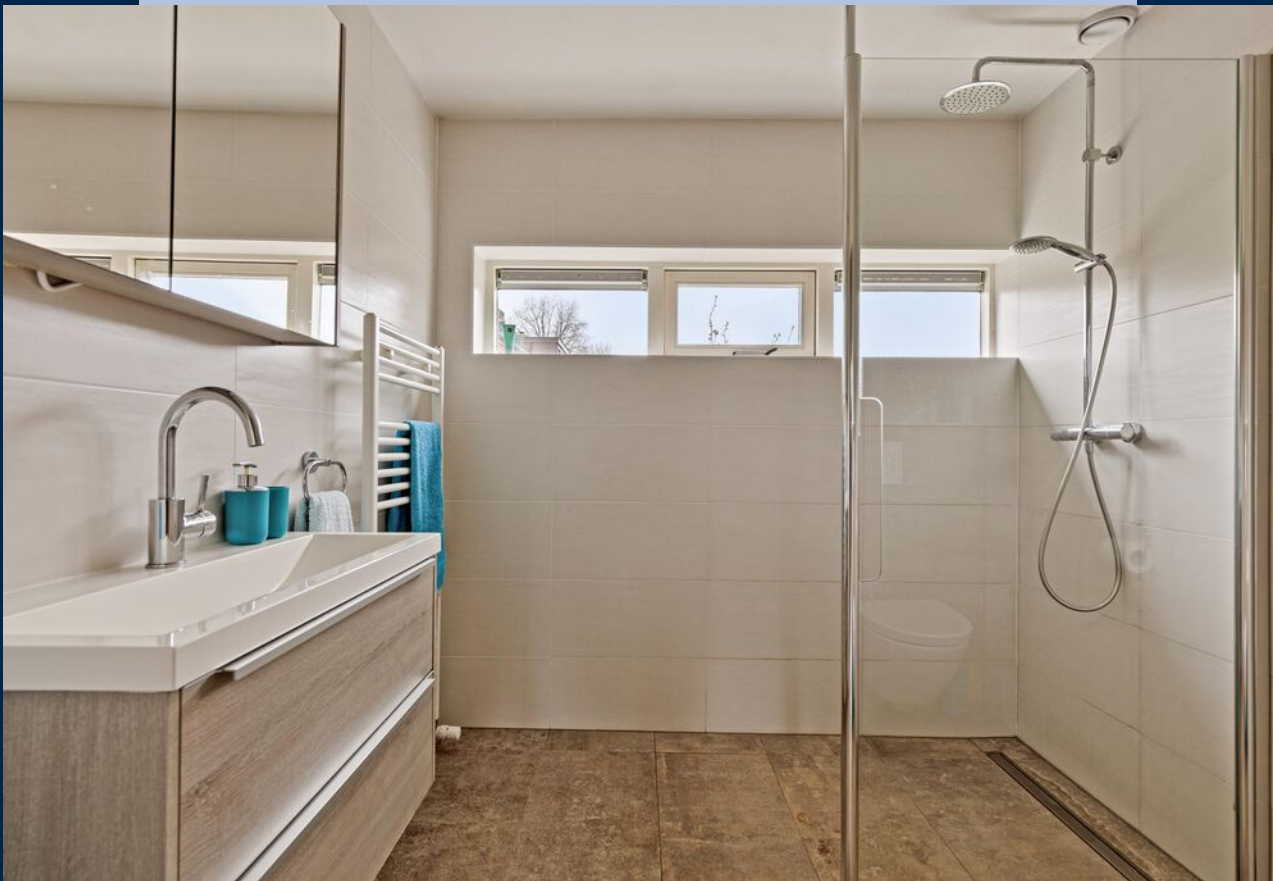
De moderne badkamer is voorzien van een wastafelmeubel, toilet en douche.