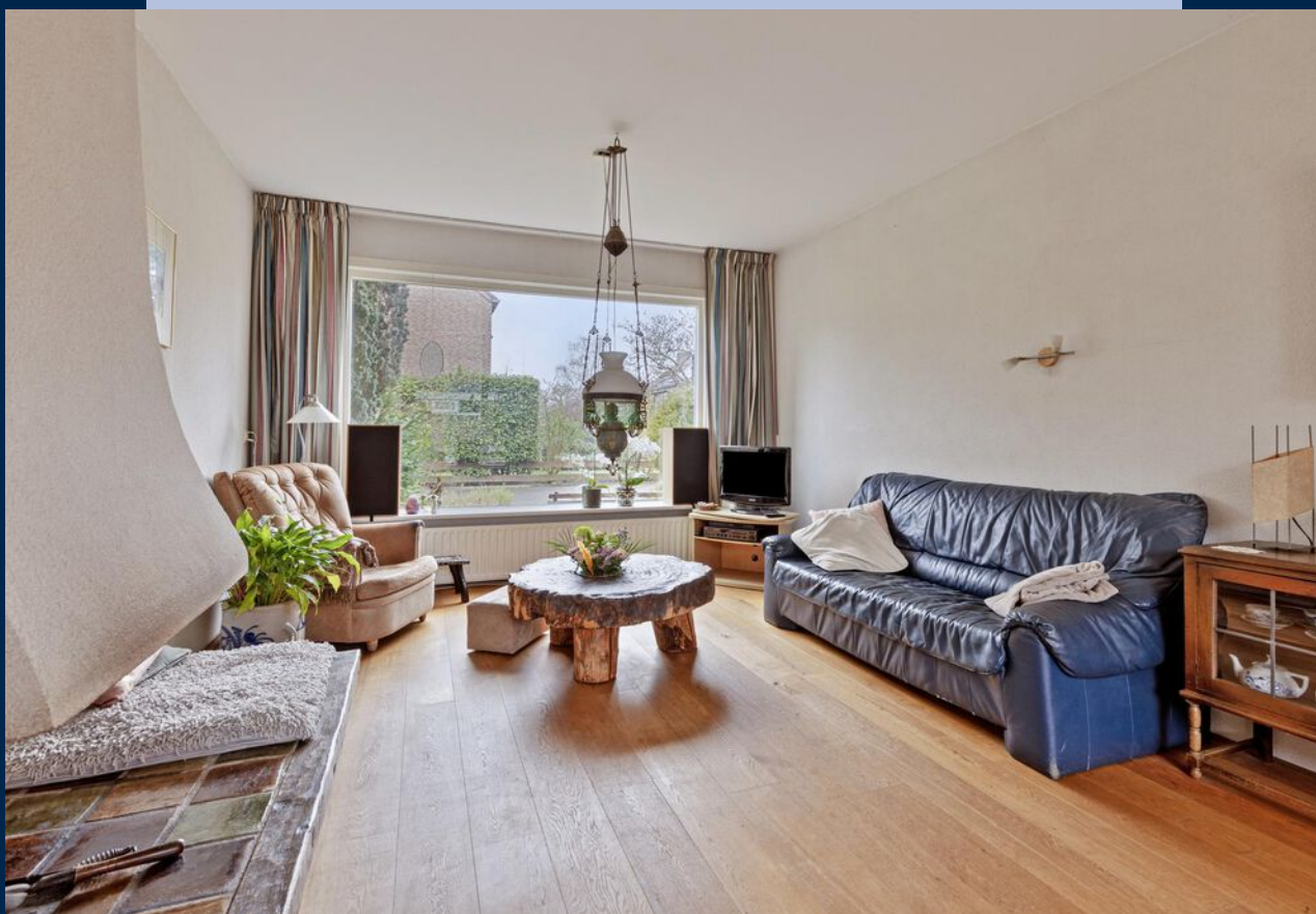
Lichte woonkamer met een sfeervolle open haard en nette eiken parketvloer.