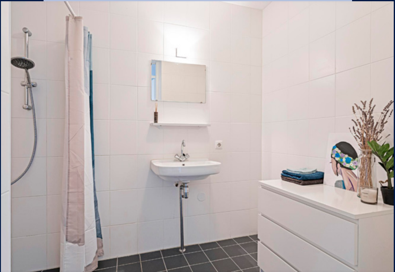
De zeer ruime badkamer heeft een douchehoek en wastafelmeubel.