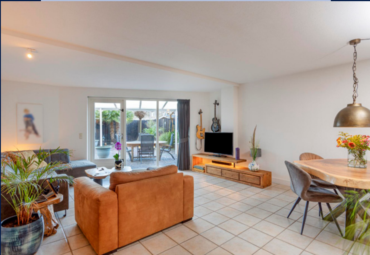
De tuingerichte woonkamer is uitgebouwd en heeft een plavuizen vloer met vloerverwarming en een deur naar de achtertuin.