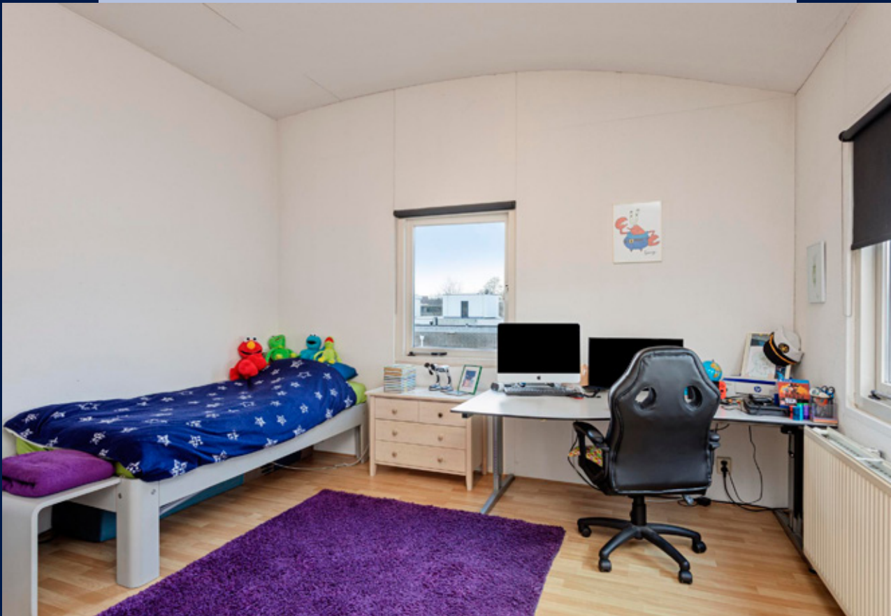
Royale tweede verdieping met 2 slaapkamers waarvan één slaapkamer beschikt over een toilet.