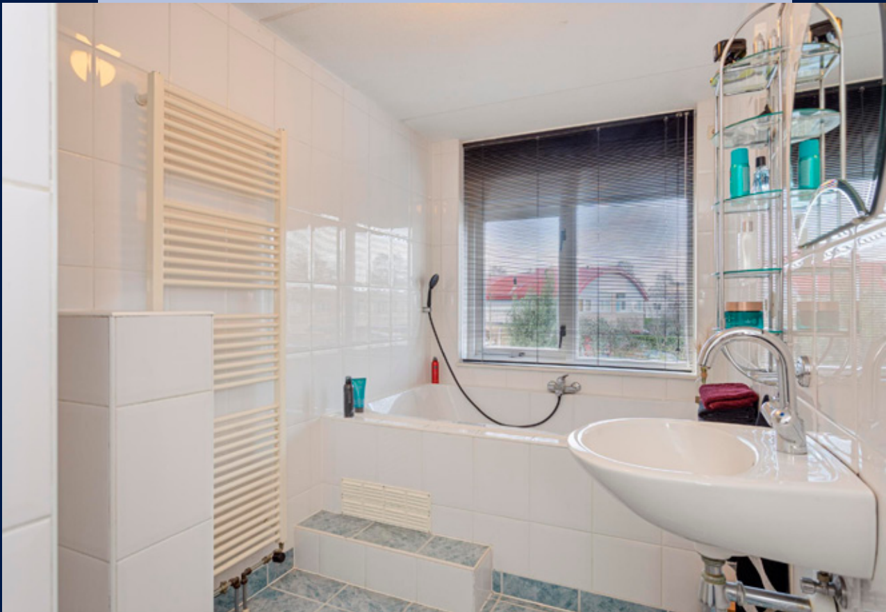
De badkamer in lichte kleurstelling heeft een inloopdouche, designradiator en een whirlpool ligbad.