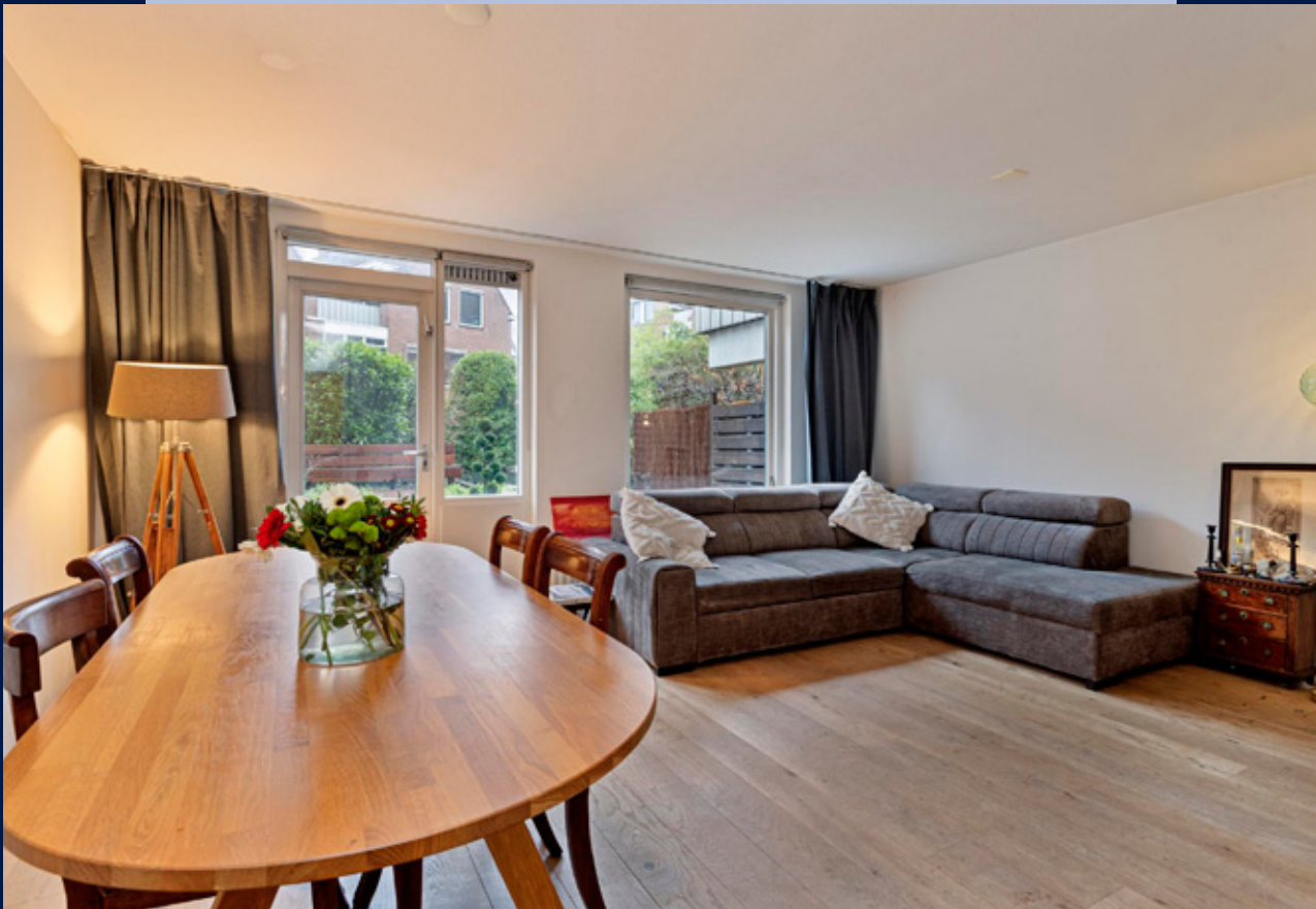
De woonkamer heeft veel lichtinval en heeft een parketvloer.