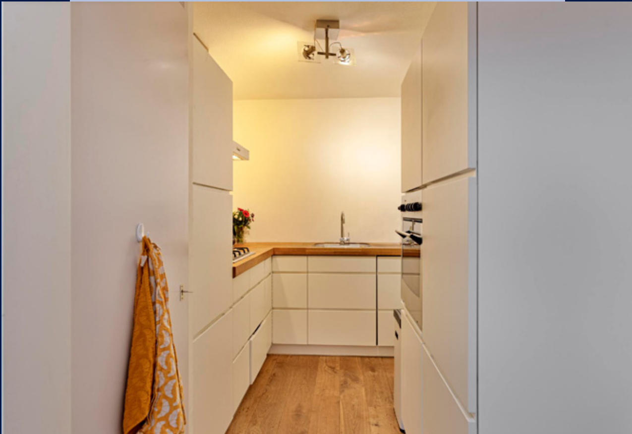
De openkeuken in lichte kleurstelling is voorzien van koel- vriescombinatie, 4-pits gasstel, oven, vaatwasser en afzuigkap.