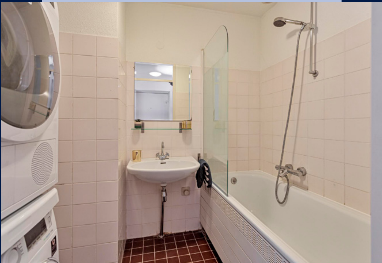
De badkamer met ligbad/douche en wasmachine en droger opstelling.