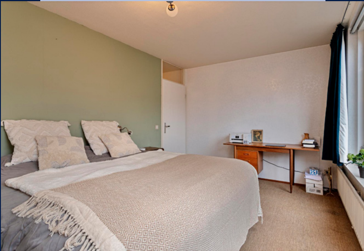
Aan de voorzijde zit de royale slaapkamer met vaste kastenwand.