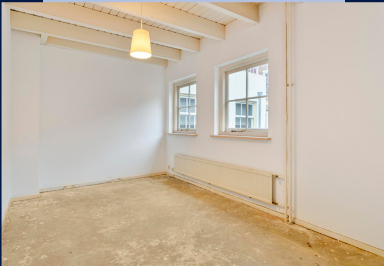
De overloop geeft toegang tot de slaapkamer en badkamer.