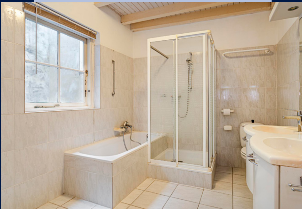
De ruime badkamer beschikt over een douche, ligbad, dubbele wastafels en toilet.