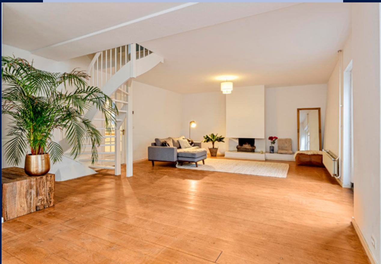
De royale woonkamer met openhaard heeft 2x openslaande deuren naar de binnenplaats.