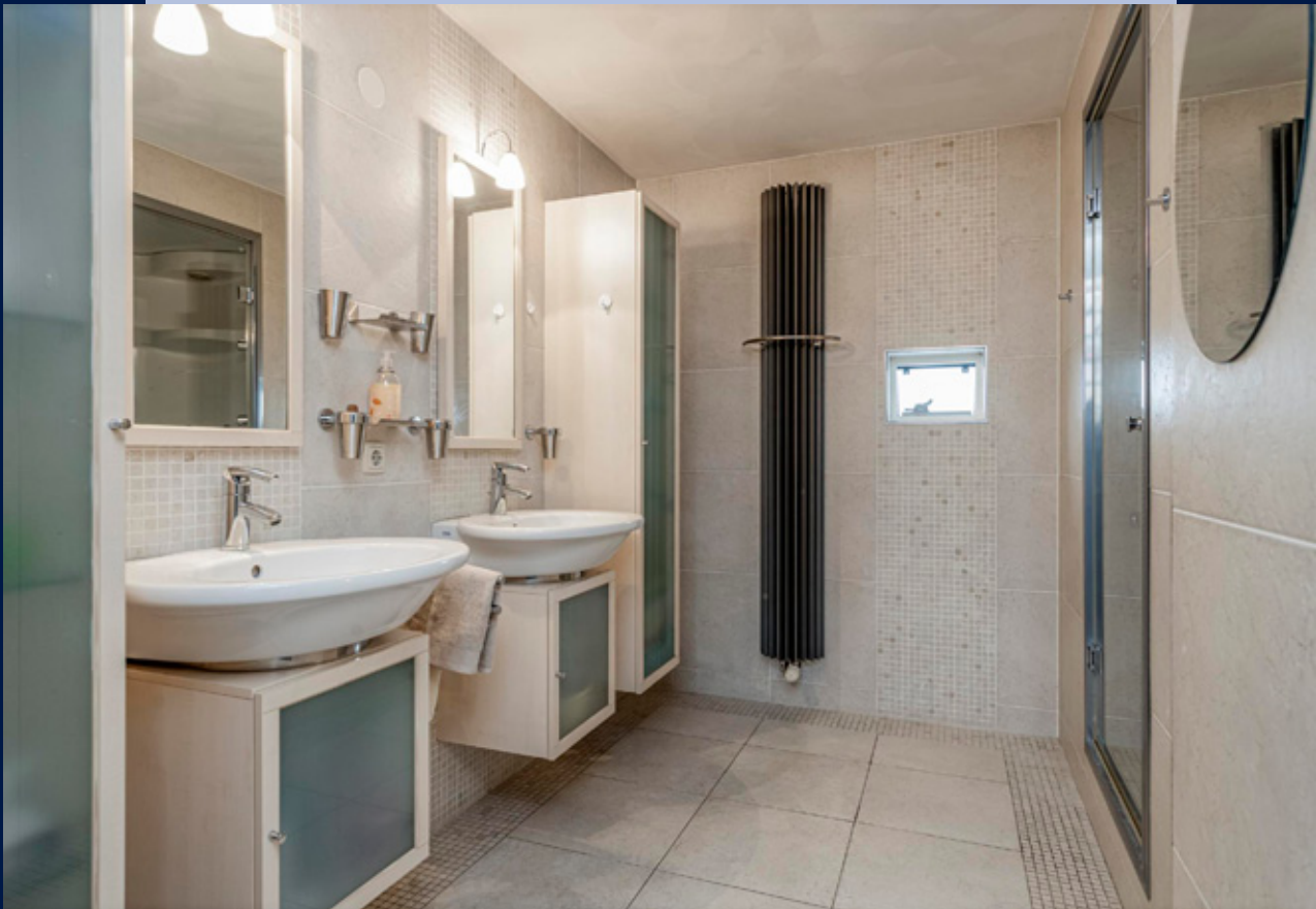
Een complete badkamer voorzien van vloerverwarming, dubbele wastafel met meubel en douche.