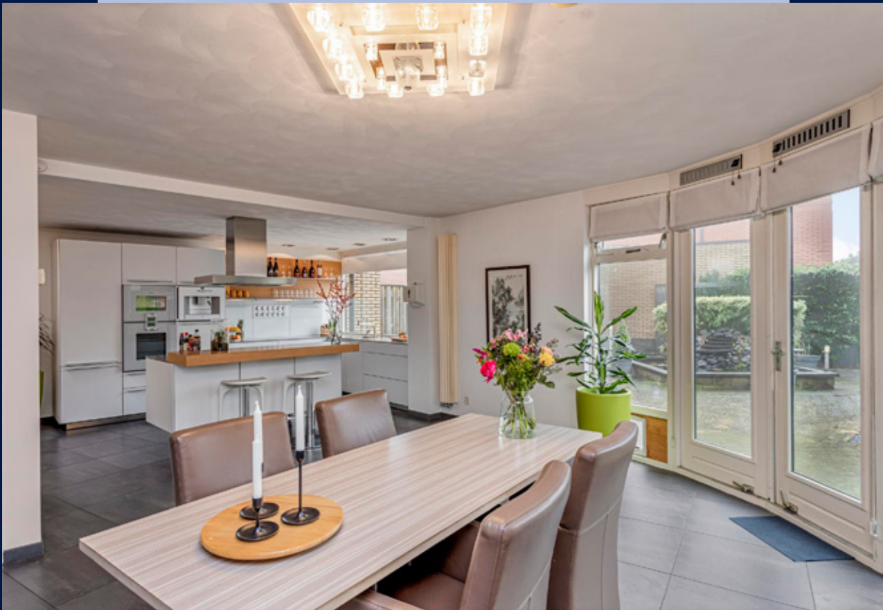
Aan de achterzijde van de woning bevindt zich de Bulthaup design keuken.