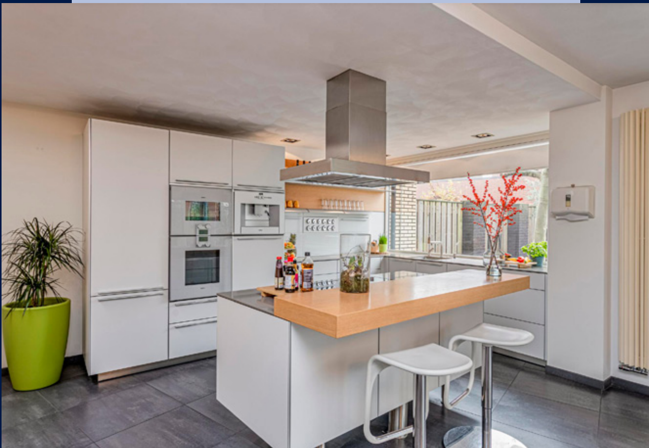
De keuken is voorzien van een inductiekookplaat, afzuigkap, vaatwasmachine, koelkast, vriezer, combi oven, steamer, Quooker, ingebouwd koffiezet apparaat en werkeiland.