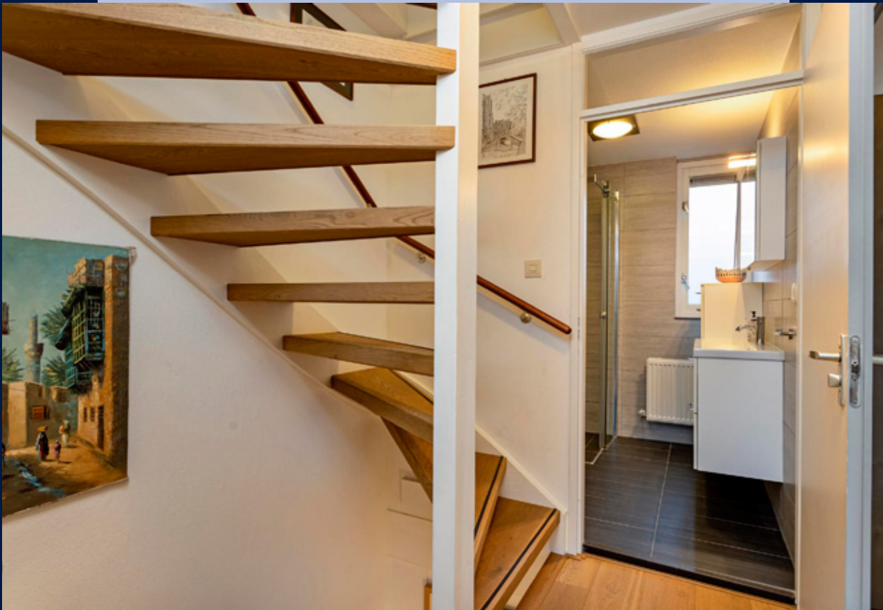
De moderne badkamer heeft een inloopdouche, wastafel met meubel en zwevend toilet.