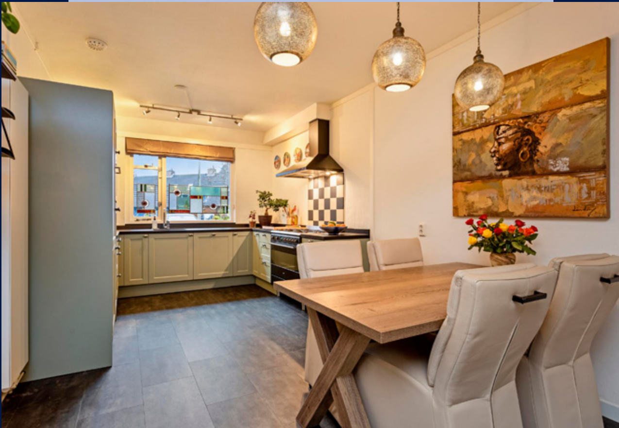
De moderne open keuken met 5- pits gaskookplaat, heteluchtoven/grill, magnetron, koelkast en vaatwasser uit 2023.