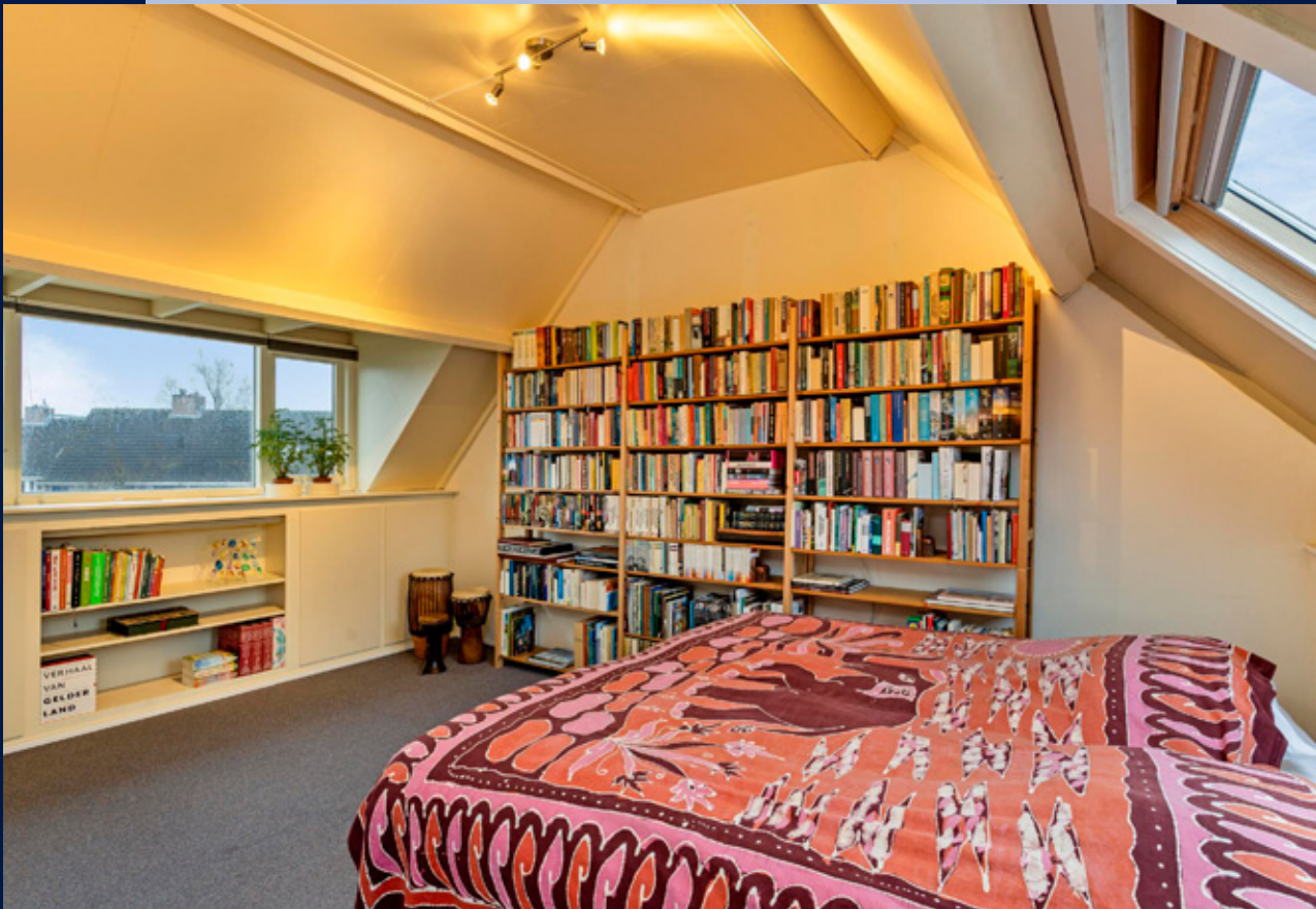
Op de ruime geïsoleerde zolderverdieping bevinden zich twee slaapkamers met veel bergruimte.