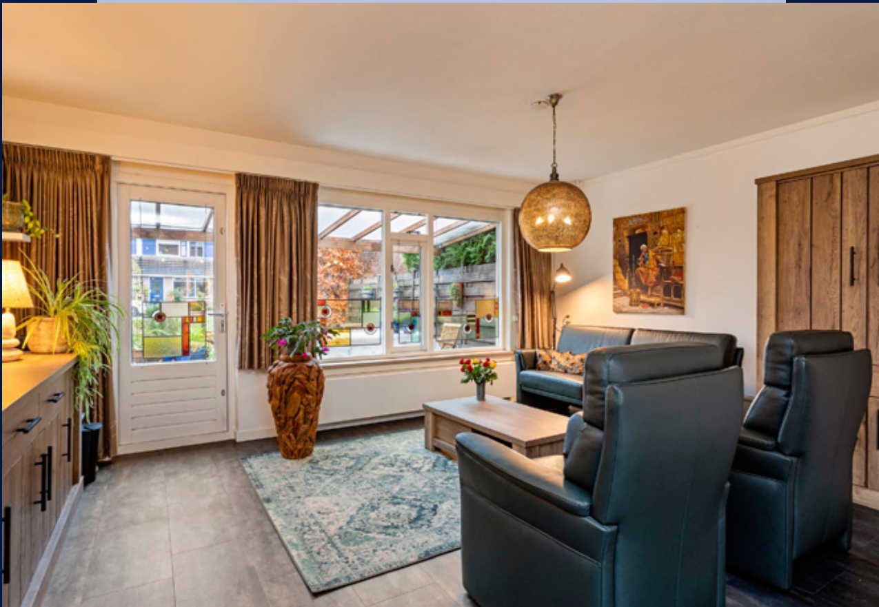
Tuingerichte ruime woonkamer voorzien van een fraaie PVC vloer uit 2020.