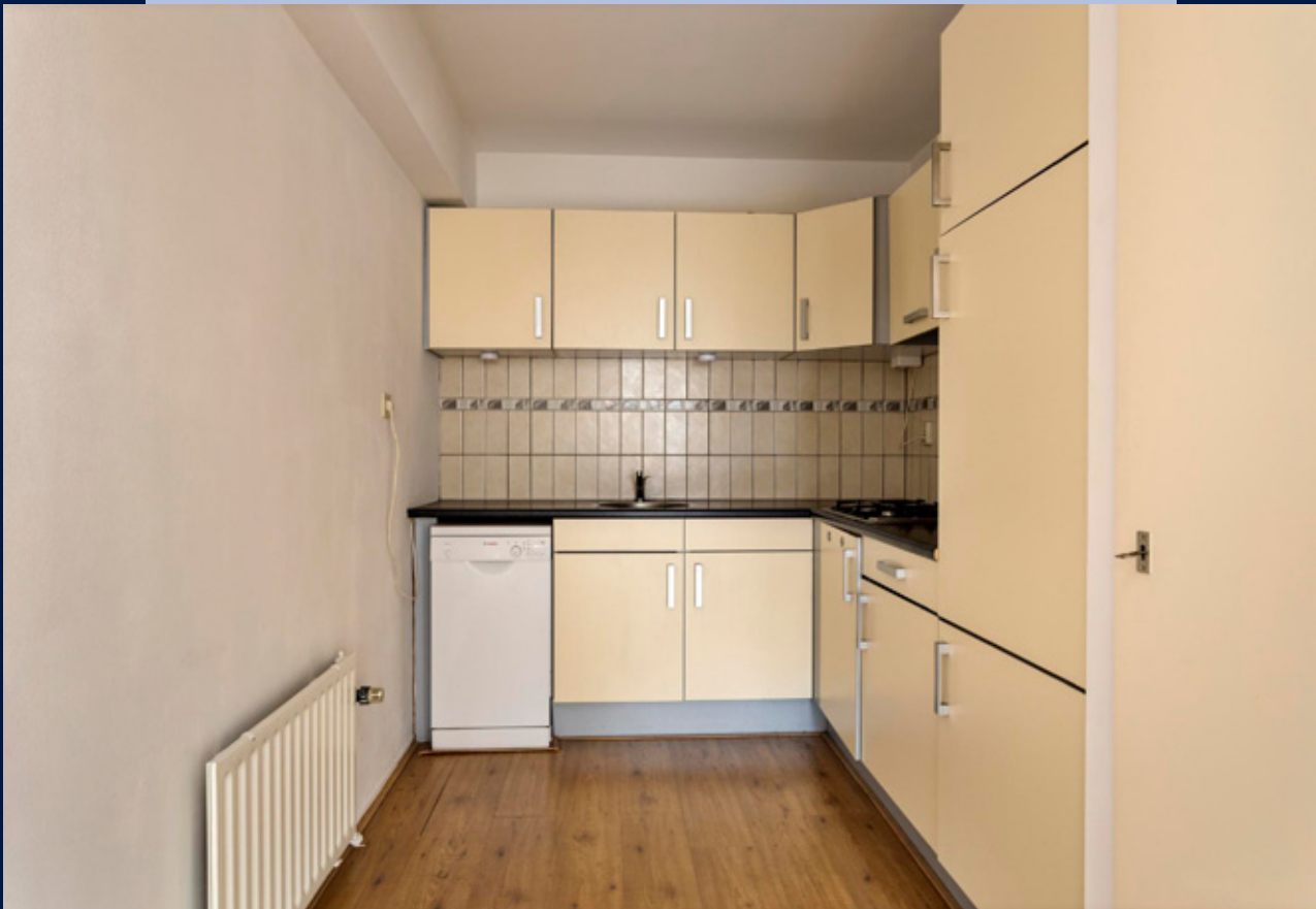
De open keuken heeft een 4-pits gasfornuis, afzuigkap, vaatwasser en koel-vriescombinatie.