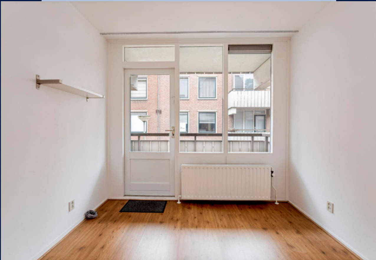
Eén van de slaapkamers geeft toegang tot het balkon gelegen op het zuidwesten.