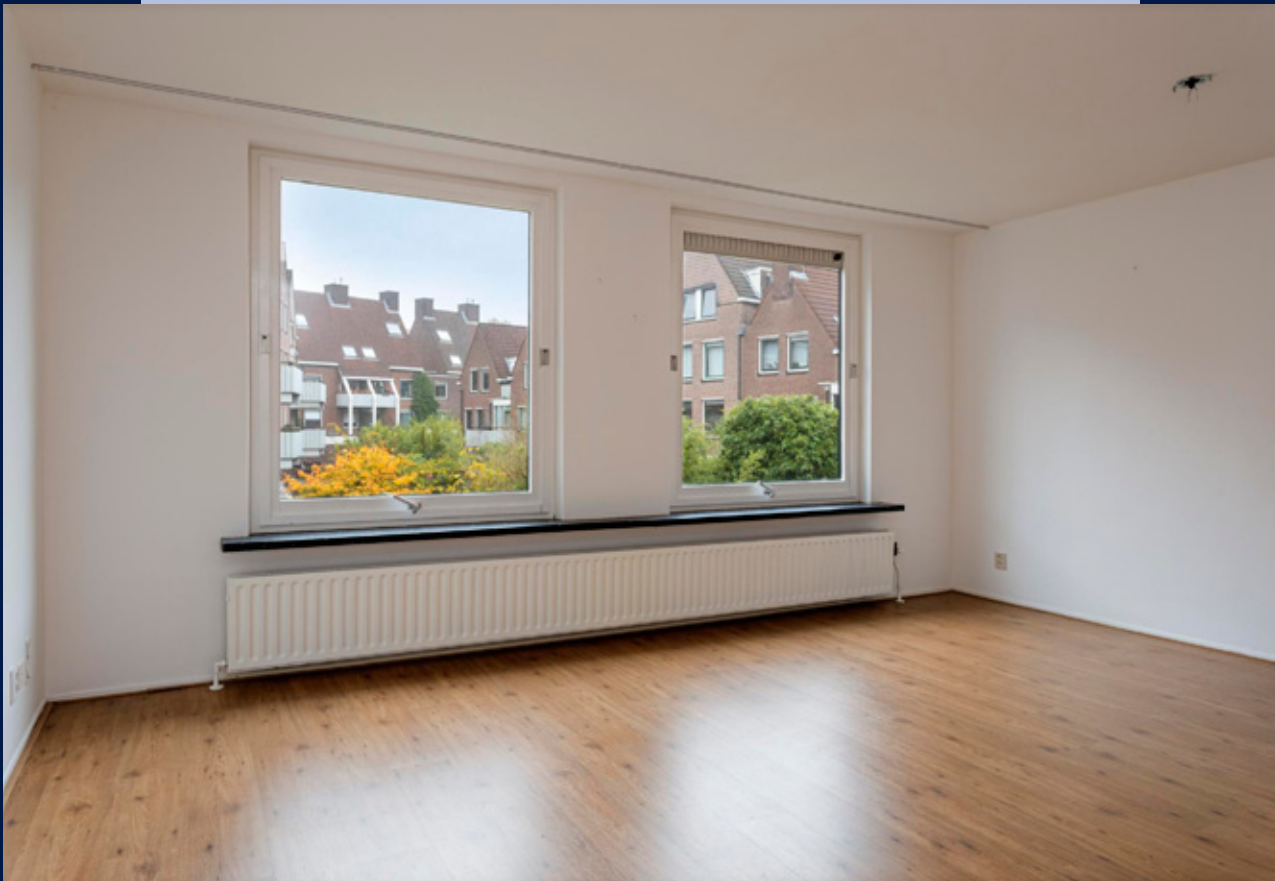
De woonkamer heeft veel lichtinval en een nette laminaatvloer.