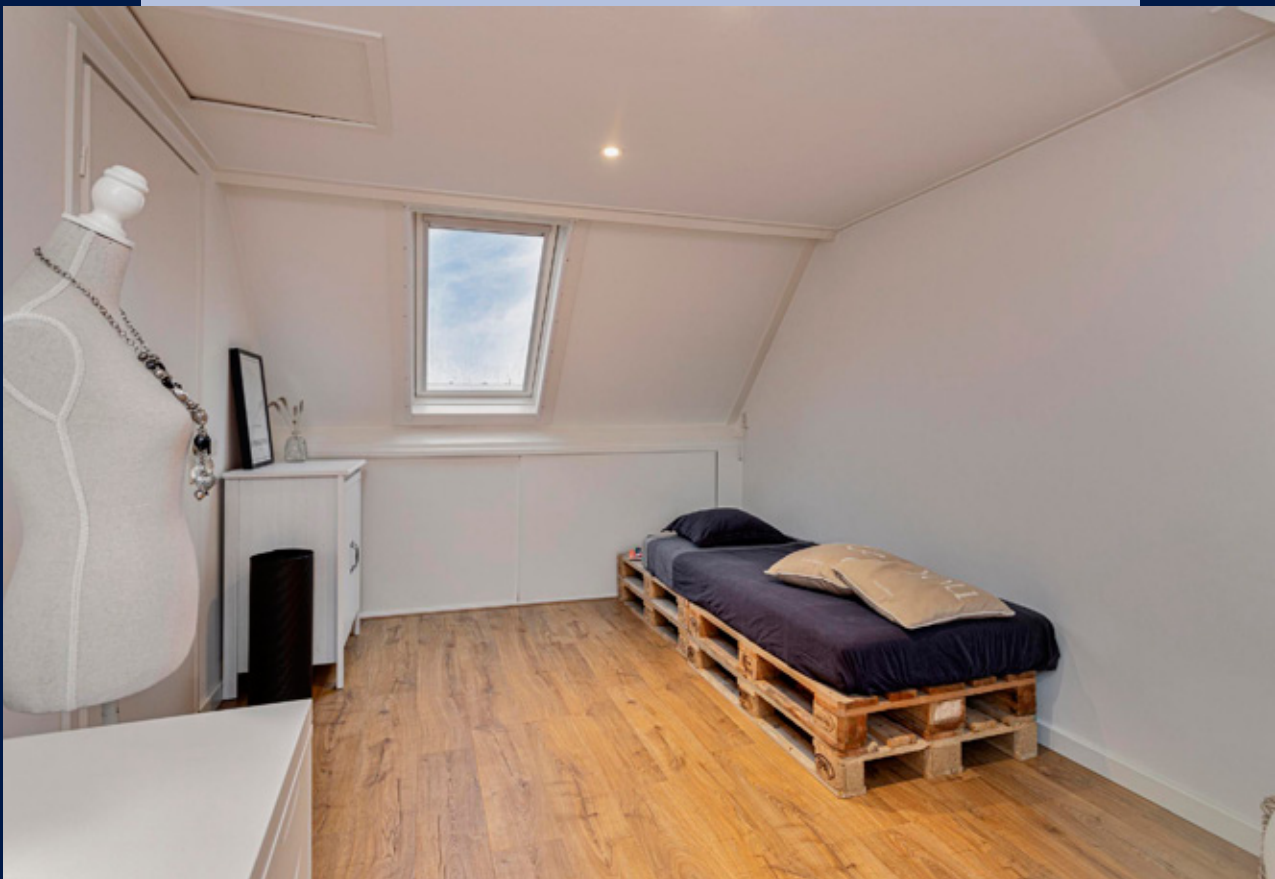
De ruime slaapkamer is voorzien van een dakraam, dakkapel en de nodige opbergruimte.