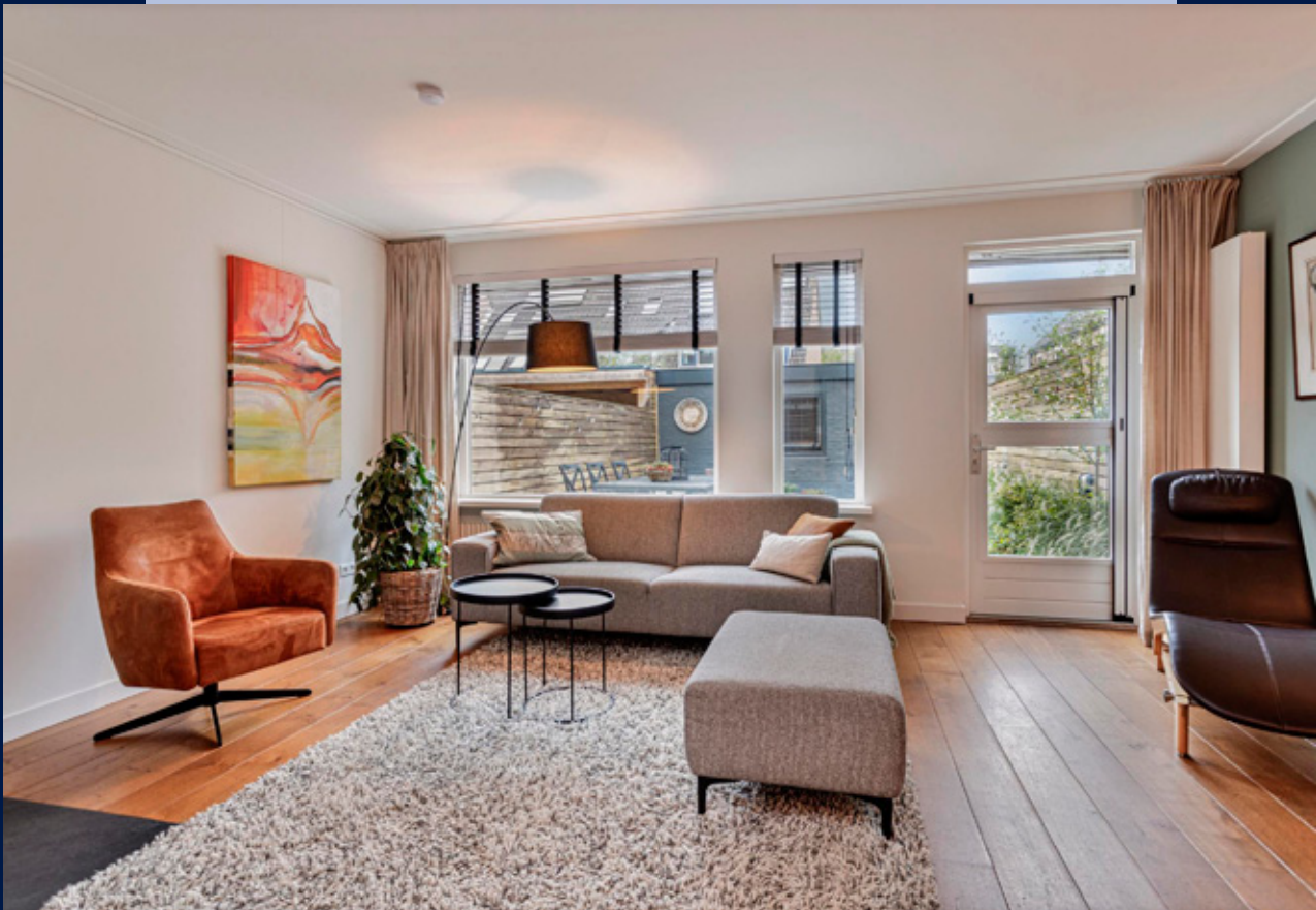
De tuingerichte L-vormige woonkamer is voorzien van een houtenvloer en heeft een fraaie hout gestookte haard.