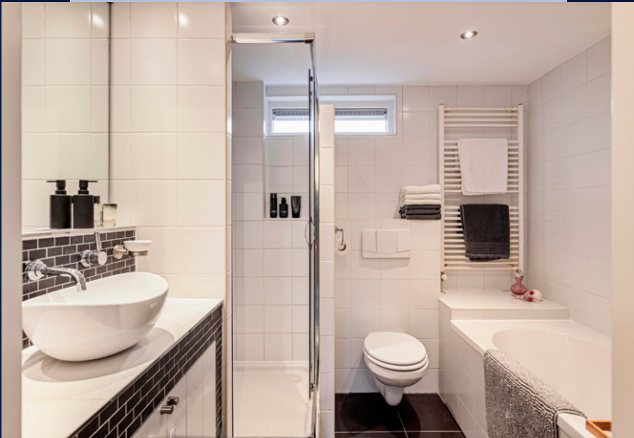
De moderne badkamer heeft een ligbad, wastafel met meubel, vrij hangend toilet en een inloofdouche.