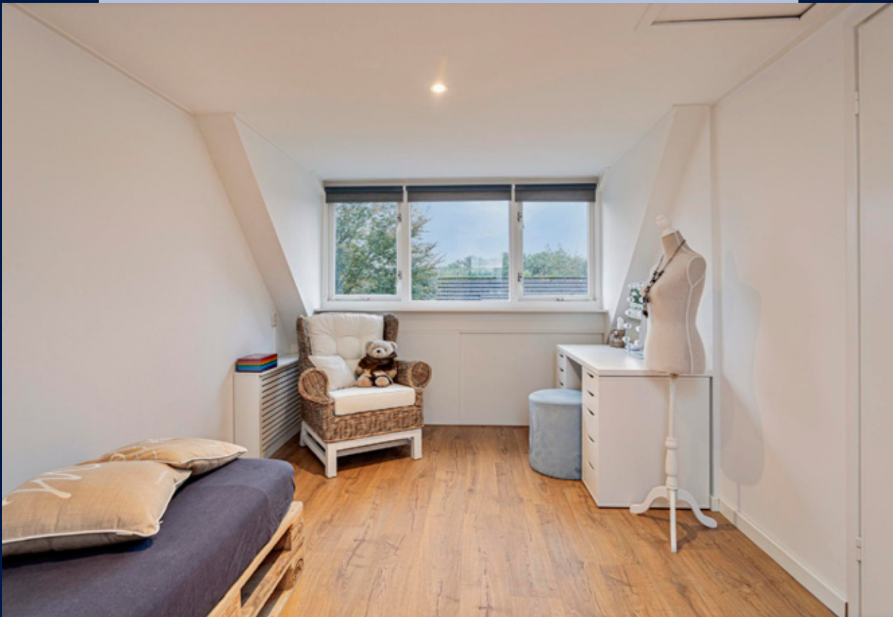
Tweede verdieping met een ruime voorzolder met vaste kasten en wasmachine/droger opstelling.