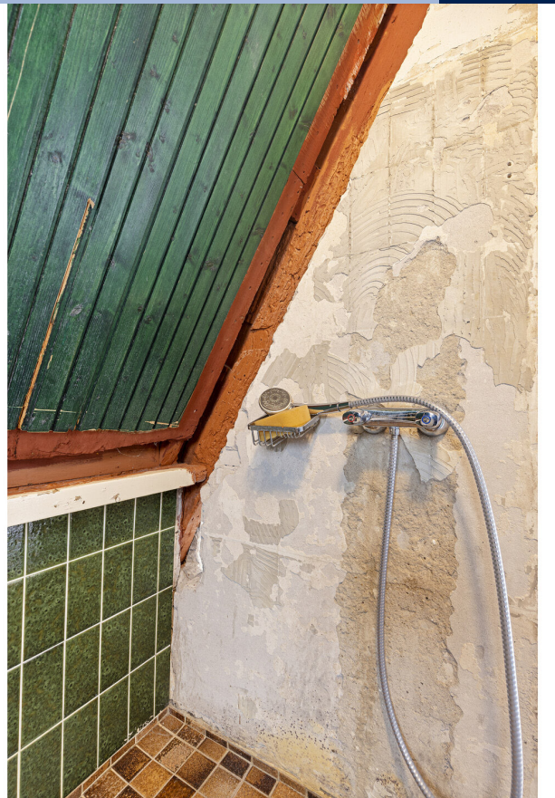
Evenals de keuken heeft badkamer modernisatie nodig, de badkamer is voorzien van douche en wastafel.