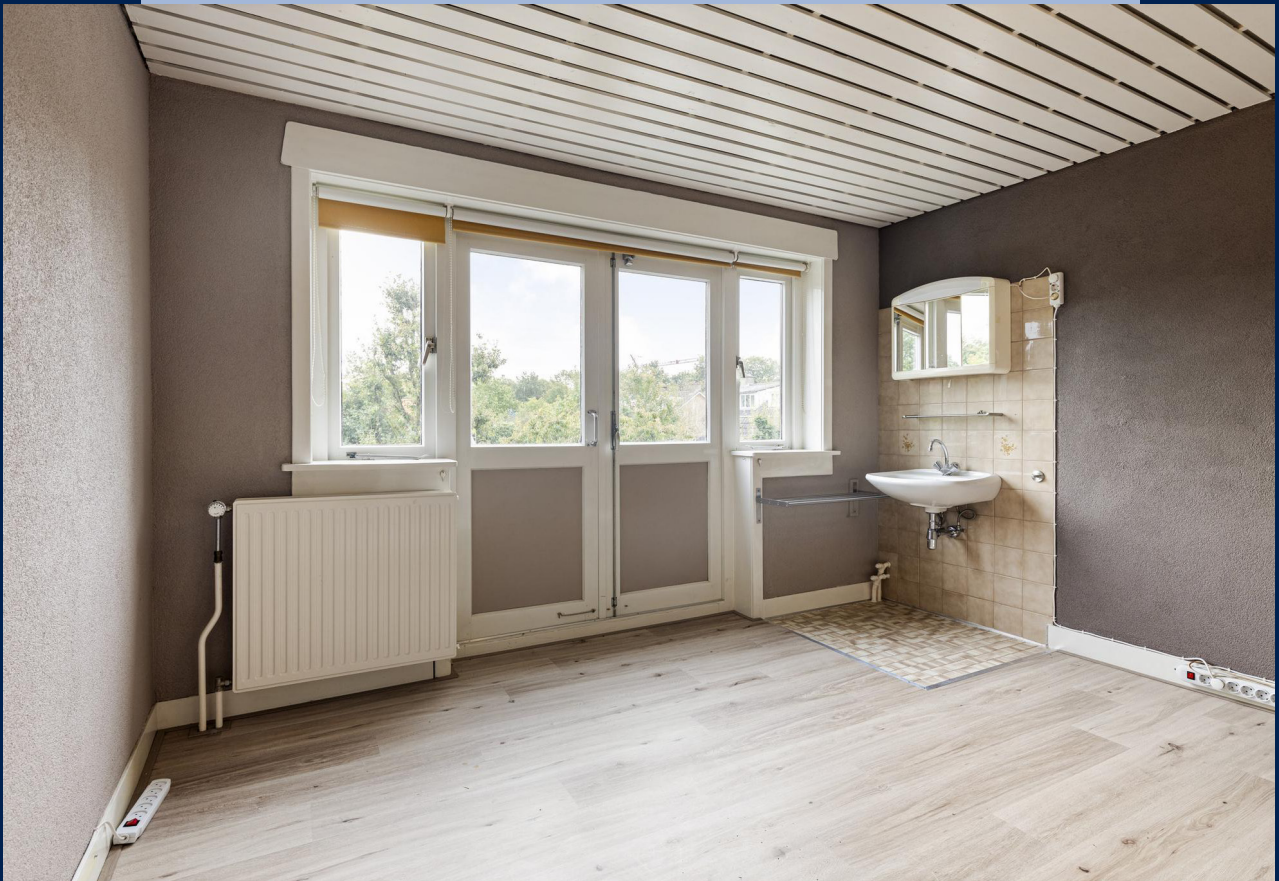
De slaapkamer aan de achterzijde beschikt tevens over een wastafel.