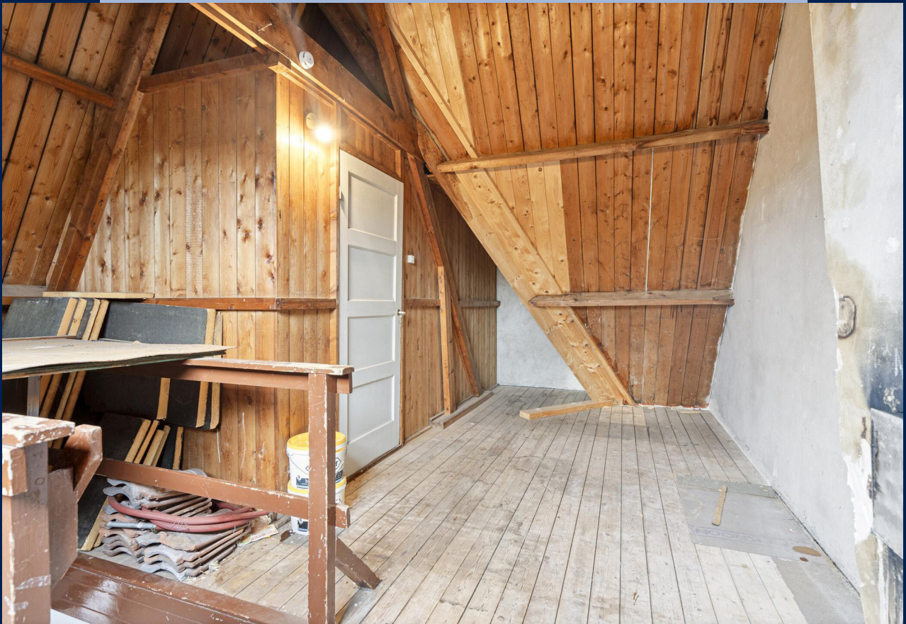
Via een vaste trap bereikbaar, grote zolder en vierde slaapkamer.