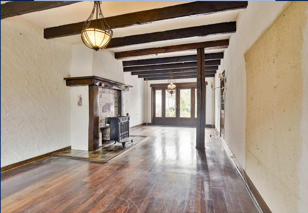
In de woonkamer zijn de originele details nog zichtbaar als de balken aan het plafond, glas-in-lood ramen en sfeervolle houtkachel.