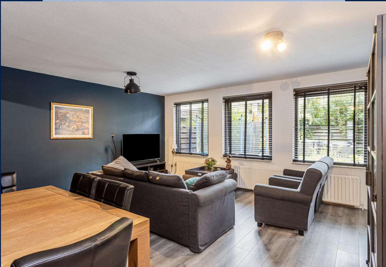
De woonkamer heeft veel lichtinval, een nette laminaatvloer en is strak afgewerkt.