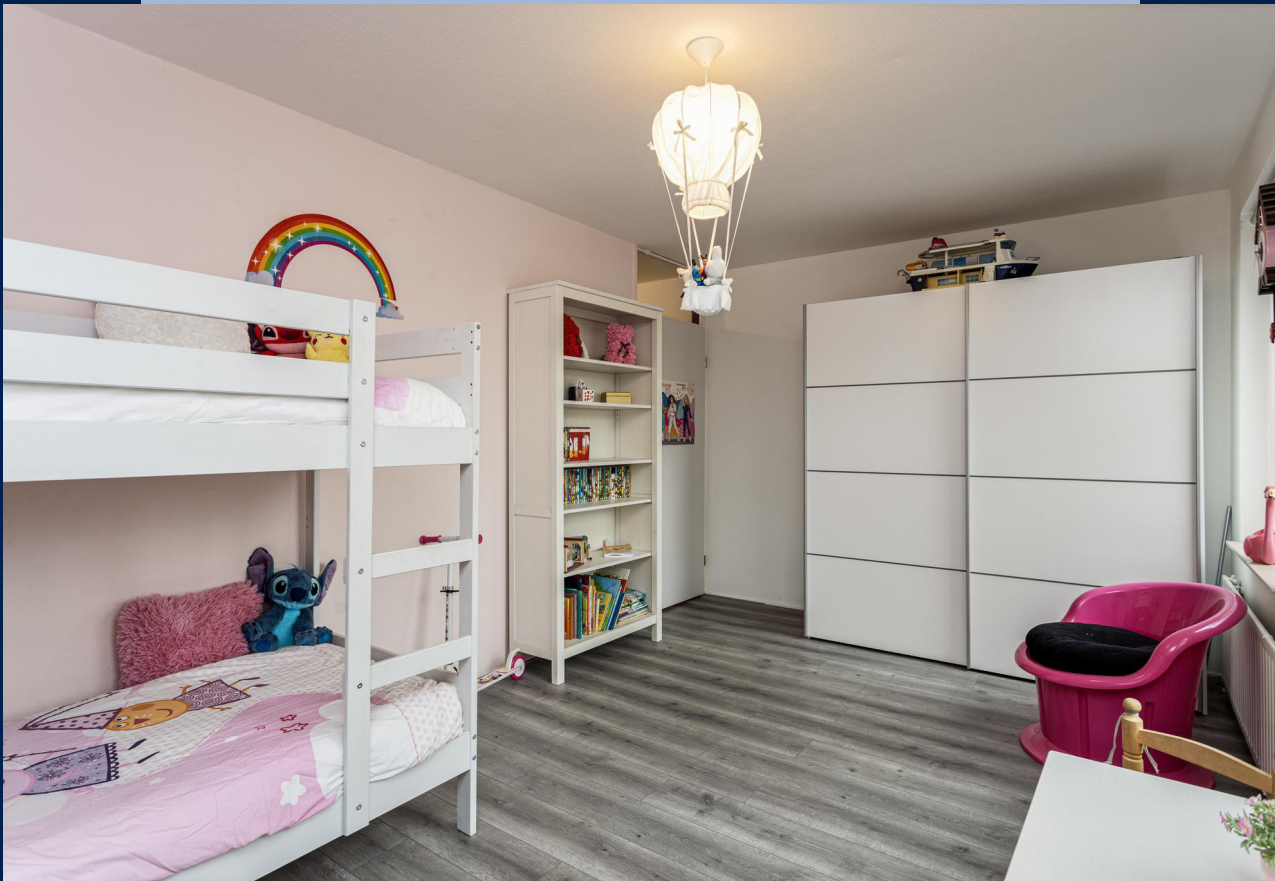
De tweede slaapkamer bevindt zich aan de voorzijde van het appartement en is gesitueerd over de hele breedte van het appartement.