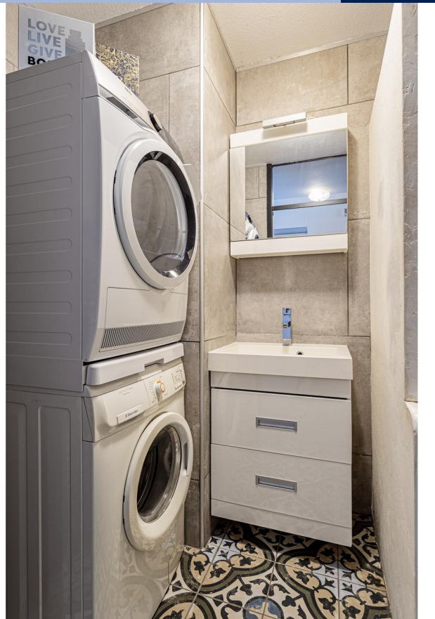
De moderne badkamer met ligbad/douche en wasmachine en droger opstelling.