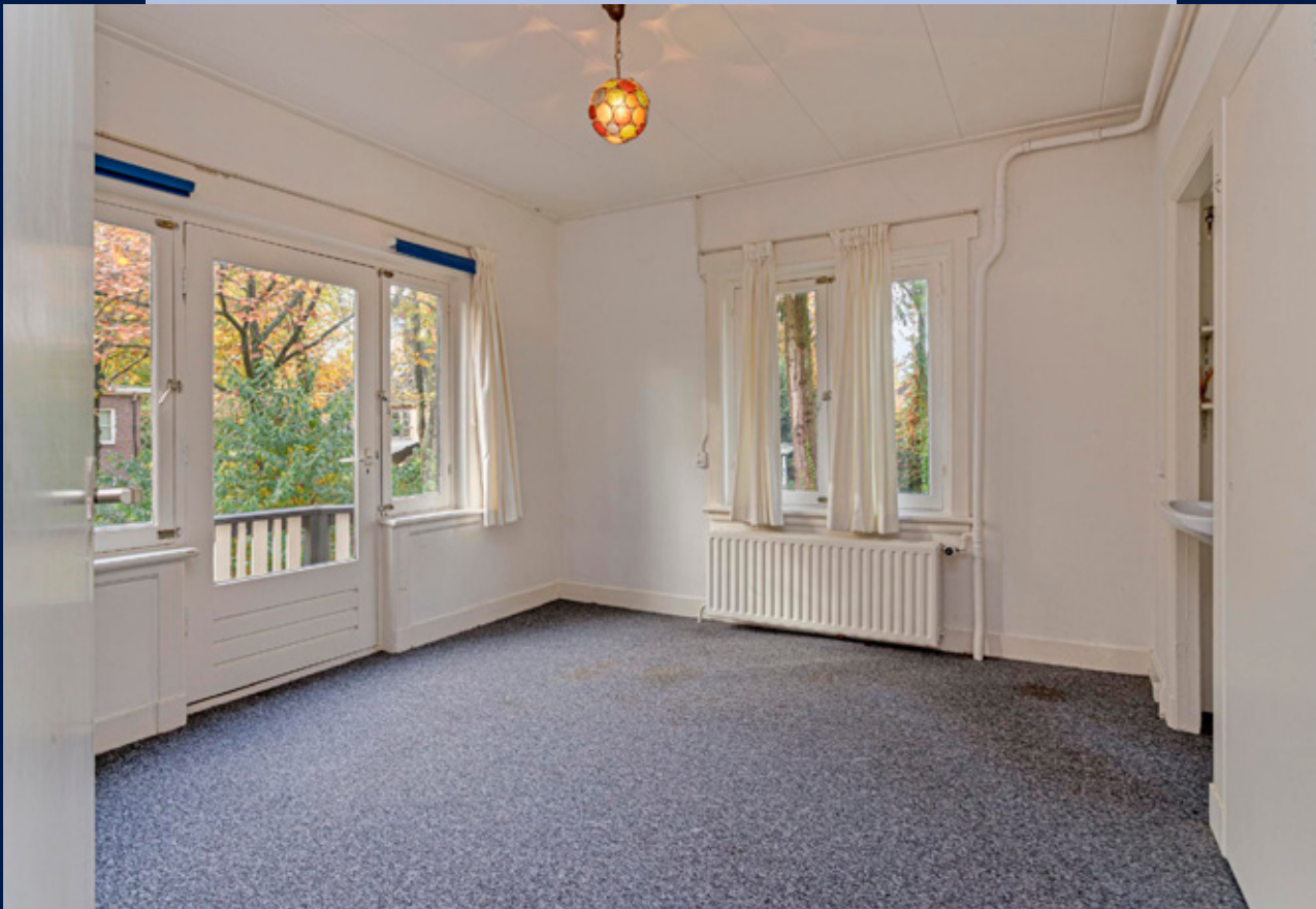
Twee van de drie slaapkamers beschikken over een balkon.