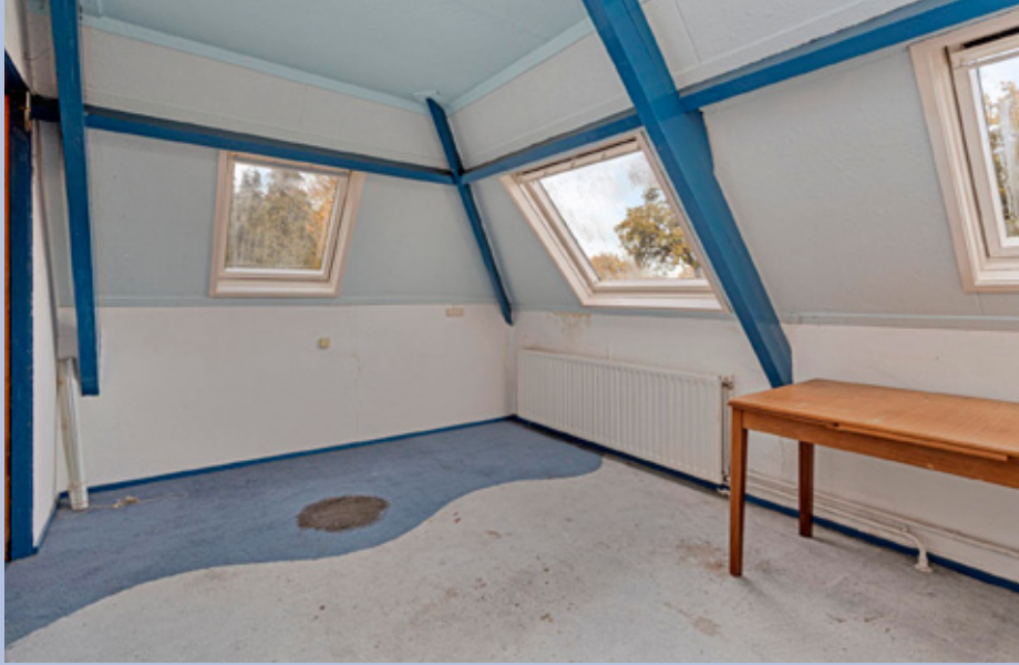
Ruime verdieping waar op het moment twee slaapkamers met wastafel zijn gesitueerd.