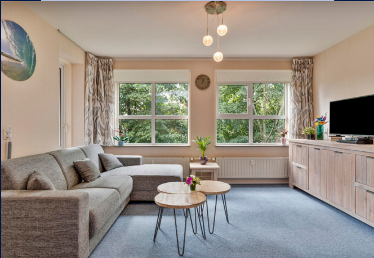
De woonkamer is aan de achterzijde gelegen en heeft mooi vrij uitzicht en toegang tot het balkon, welke is gelegen op het zuiden.