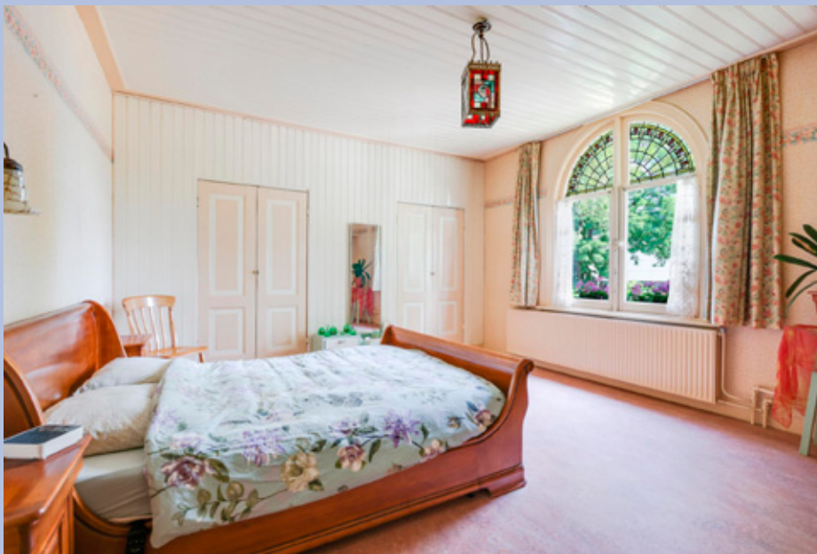
Twee ruime slaapkamers zijn voorzien van vaste kasten met veel opbergruimte.