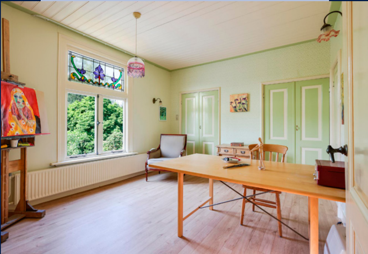
De ramen op de eerste verdieping hebben een mooie glas in lood afwerking.