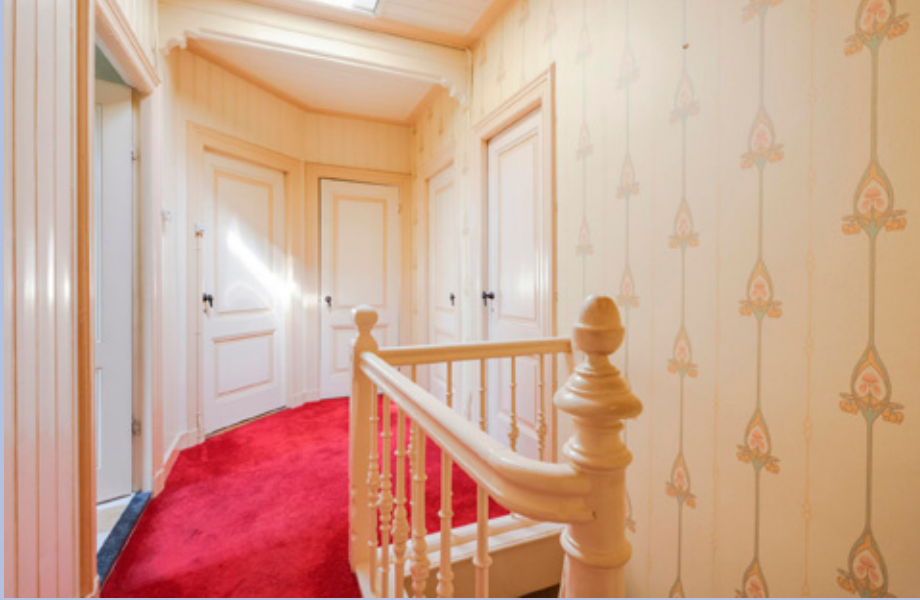
Een royale overloop met toegang tot de badkamer, de bergzolder en drie slaapkamers.