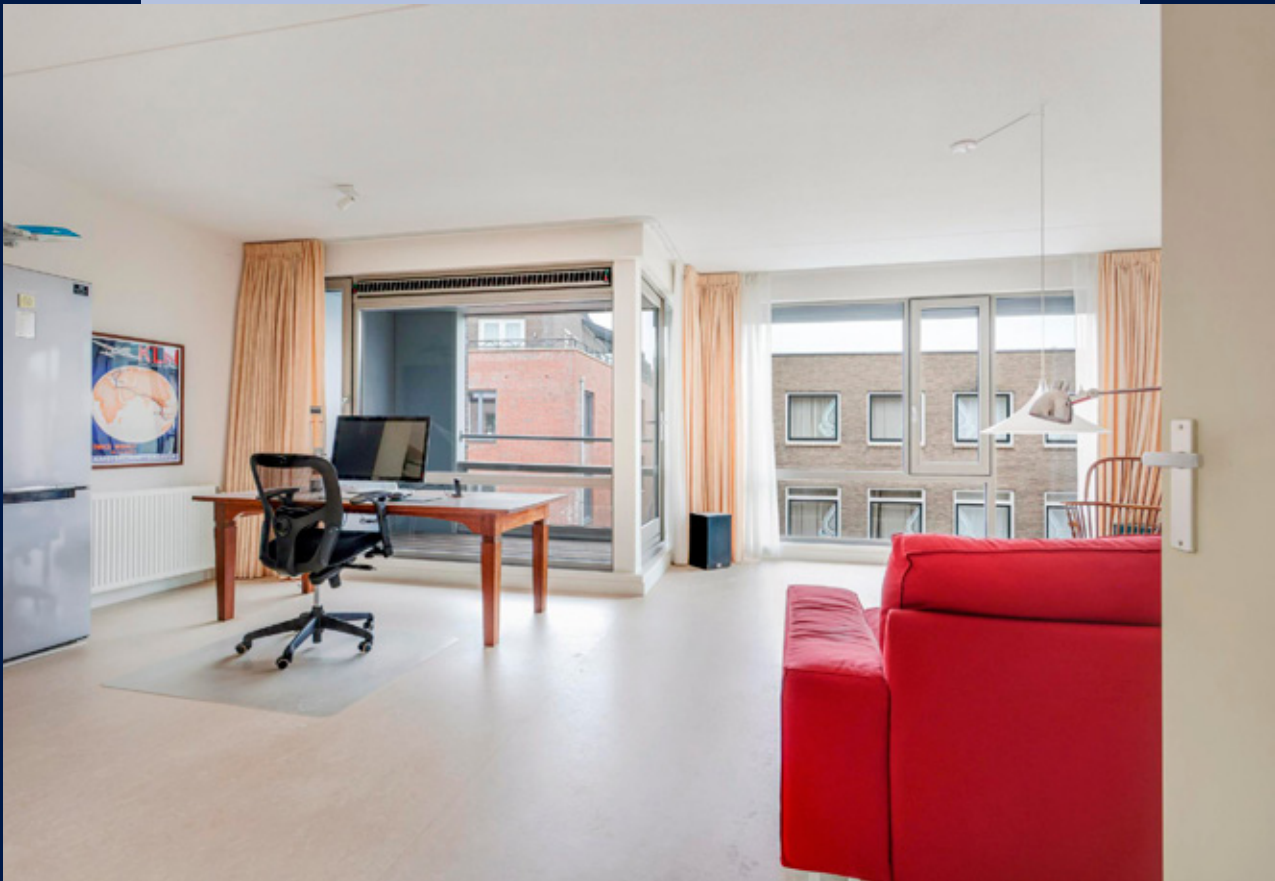
De woonkamer is aan de voorzijde van het complex gelegen. De grote ramen zorgen voor veel lichtinval.