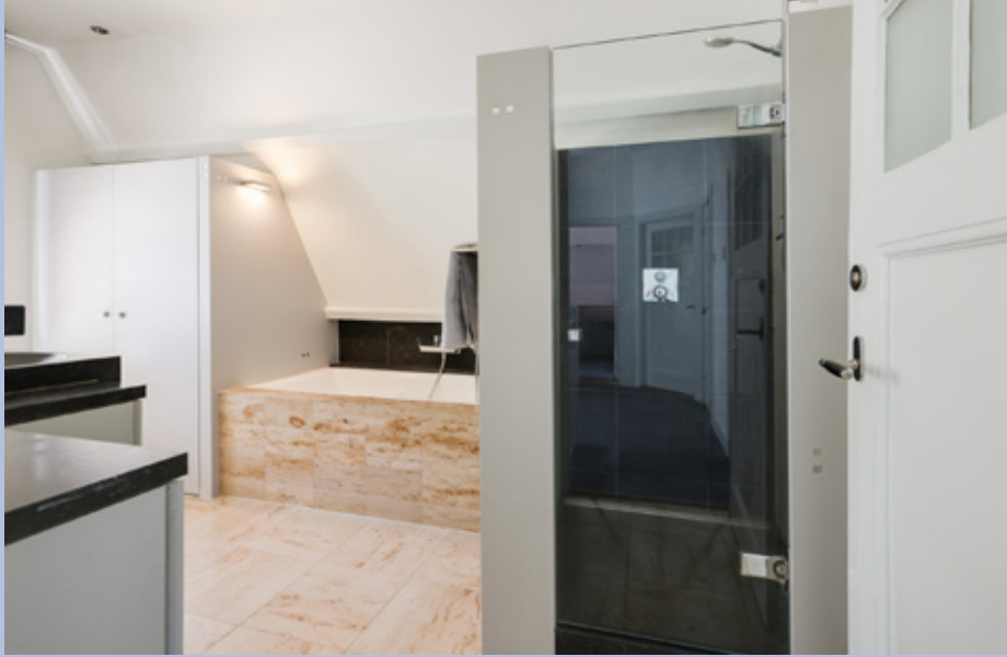
De luxe badkamer heeft een dubbele wastafel met meubel, een groot ligbad en inloopdouche.