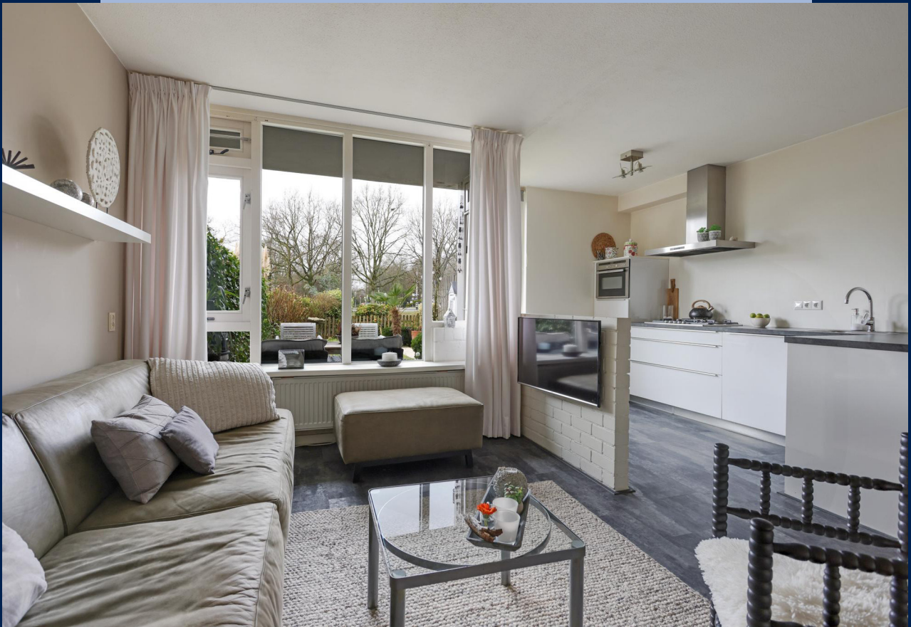
De lichte woonkamer heeft een fraai uitzicht op de heerlijke achtertuin.