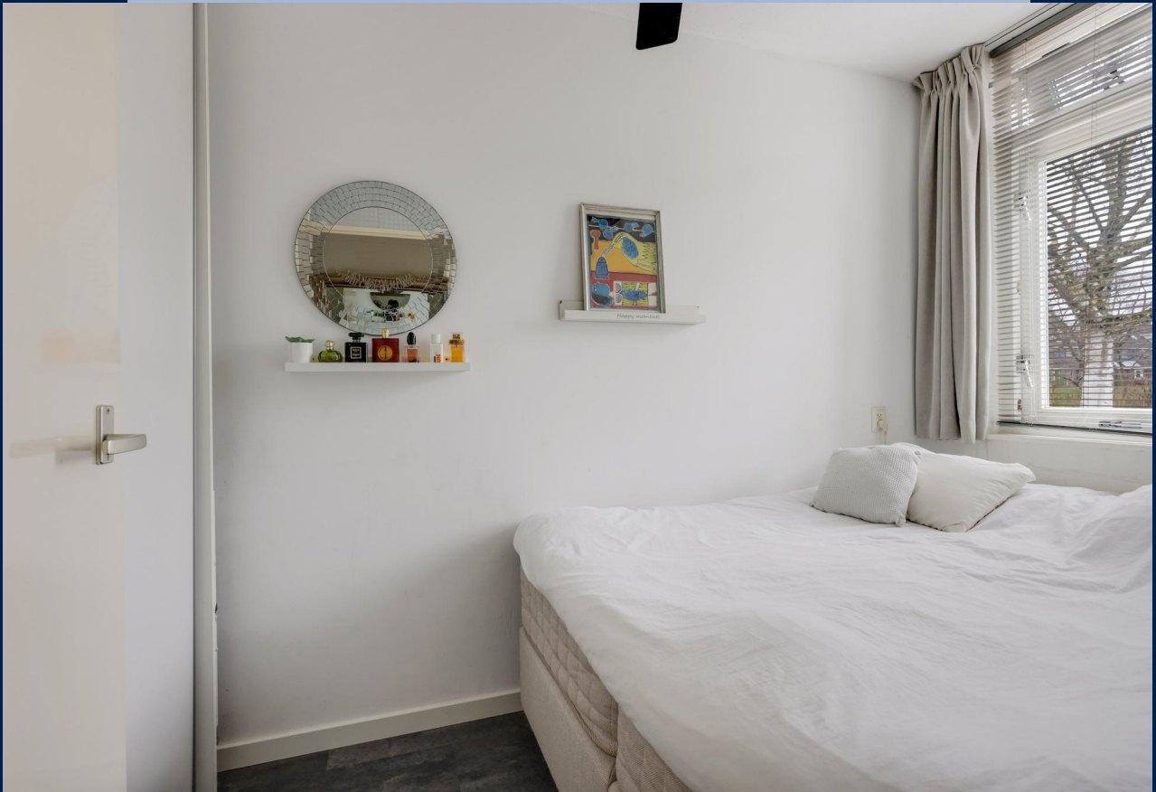
Het appartement beschikt over 1 slaapkamer.