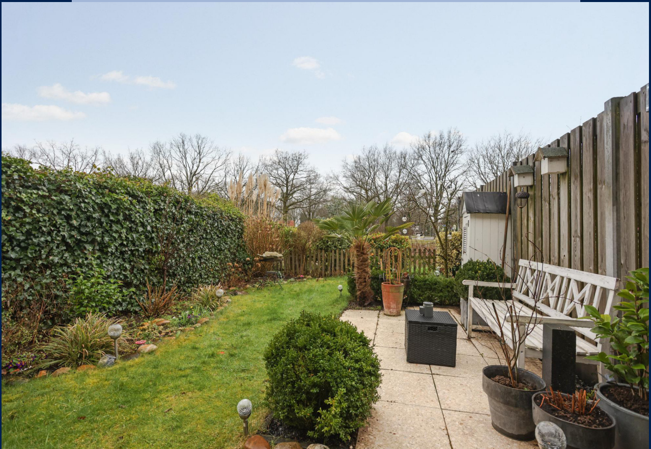
De tuin is gelegen op het zuidwesten, is heerlijk beschut en fraai aangelegd.