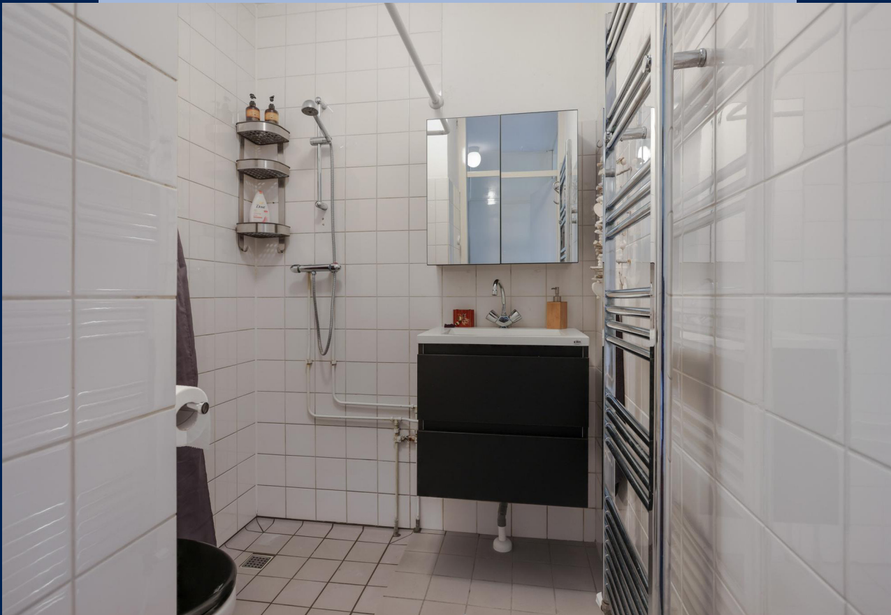
De badkamer met douche, wastafel en toilet.