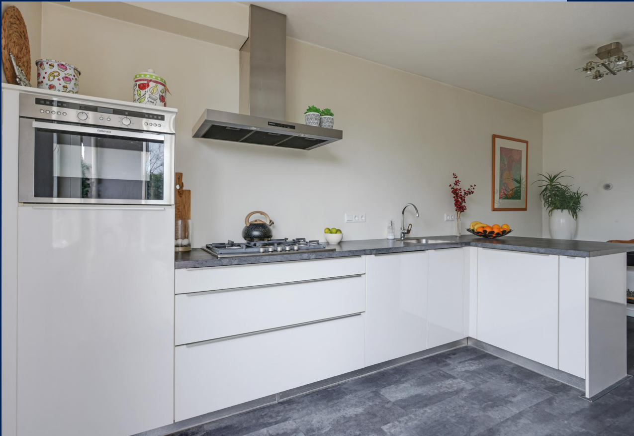
De moderne open keuken (Tulp) beschikt over diverse inbouwapparatuur zoals: vaatwasser, combimagnetron, 5-pits gasfornuis, afzuigkap en een koelkast met vriesvak.