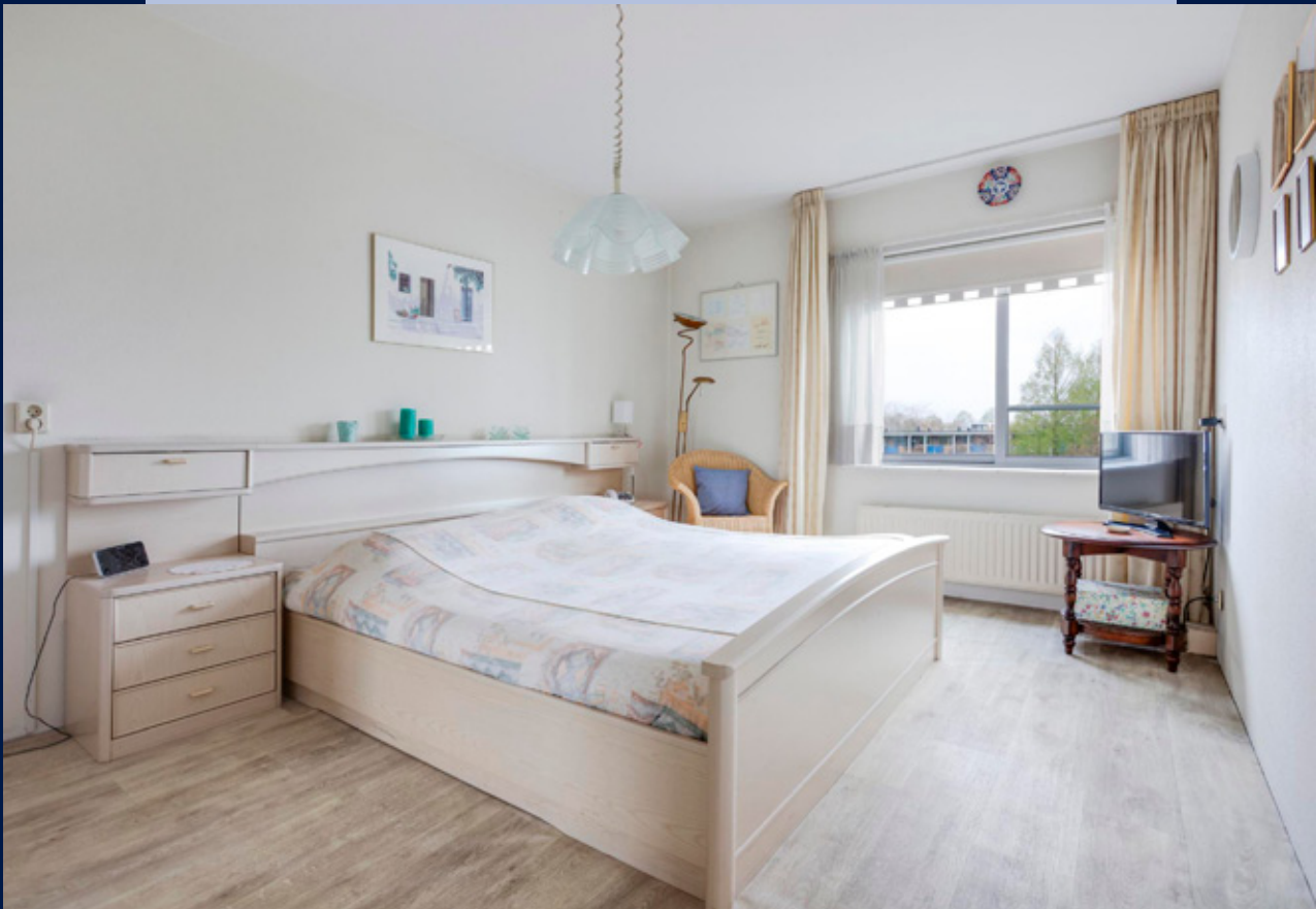
Het appartement beschikt over twee slaapkamers waarvan er één met een vaste kastenwand.