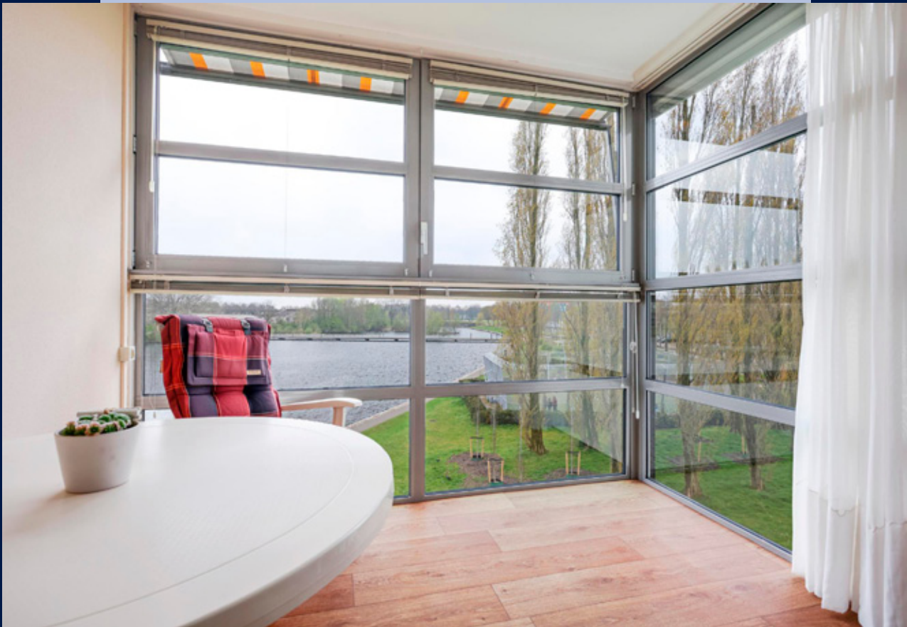
De ramen van de loggia zijn gedeeltelijk te openen en er zijn zonneschermen aanwezig.