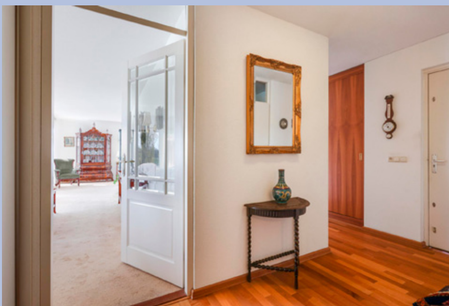
Entree met videofoon, separate toiletruimte met closet en fontein, meterkast, bergkast met cv-opstelling en wasmachine aansluiting en een vaste kastenwand met garderobe.