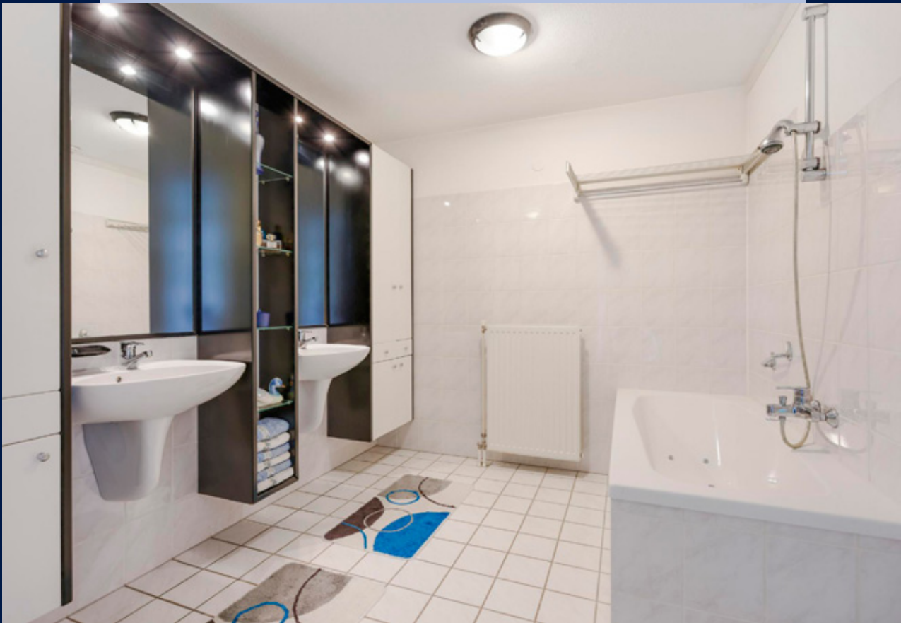
Ruime badkamer met een ligbad, douche, dubbele wastafel en een groot bergmeubel.