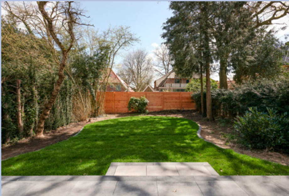
De riante tuin is gelegen op het zuidoosten en biedt mogelijkheden tot diverse zonnige of schaduwrijke plekjes