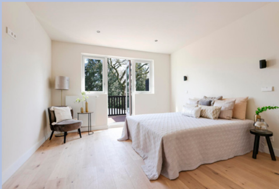
De grootste slaapkamer is gelegen aan de achterzijde en beschikt over een balkon.