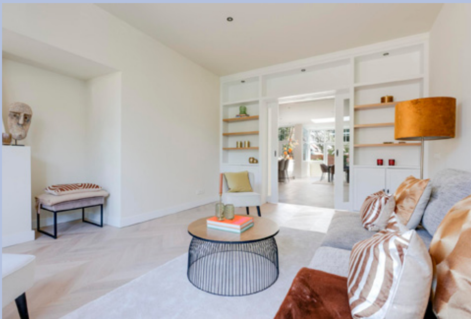
De woonkamer met en-suite schuifdeuren en aan weerszijden vaste kasten.