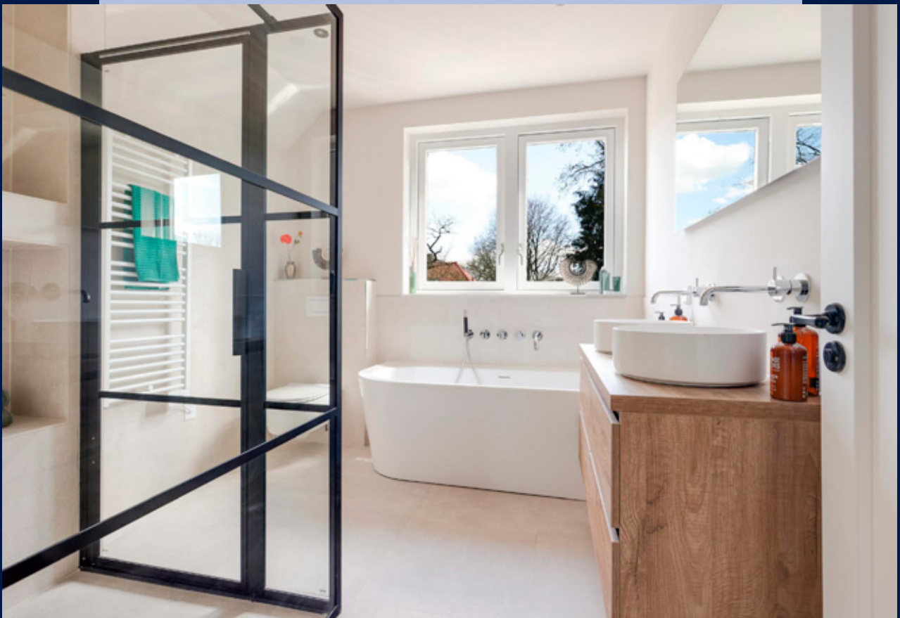
De luxe en complete badkamer beschikt over een inloopdouche, ligbad, dubbele wastafel en toilet.