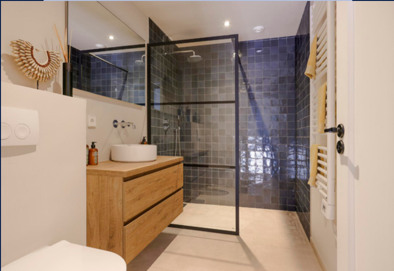
Deze fraai afgewerkte badkamer is voorzien van inloopdouche, wastafel, designradiator en toilet.