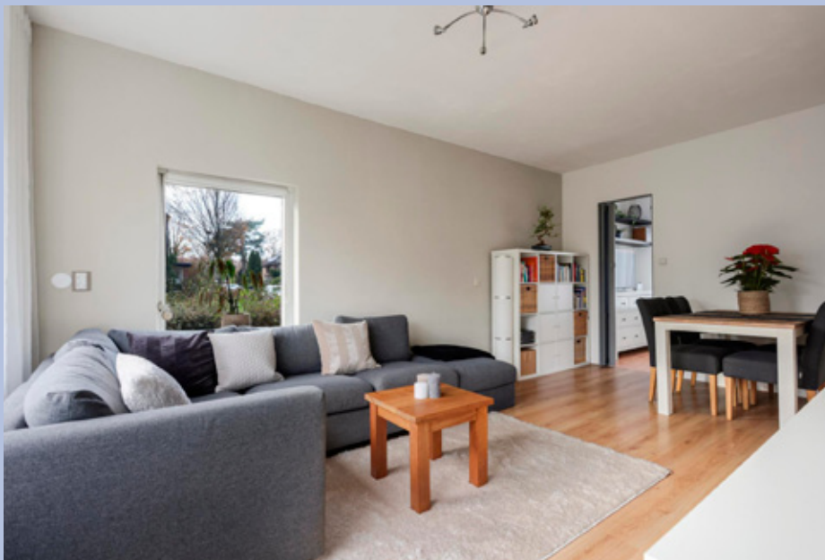
Woonkamer met laminaatvloer.