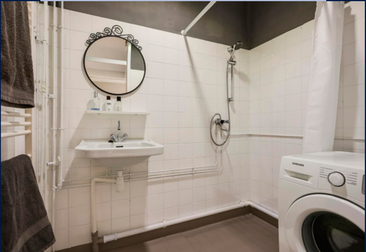
Begane grond: badkamer met wastafel, douche en aansluiting wasmachine.