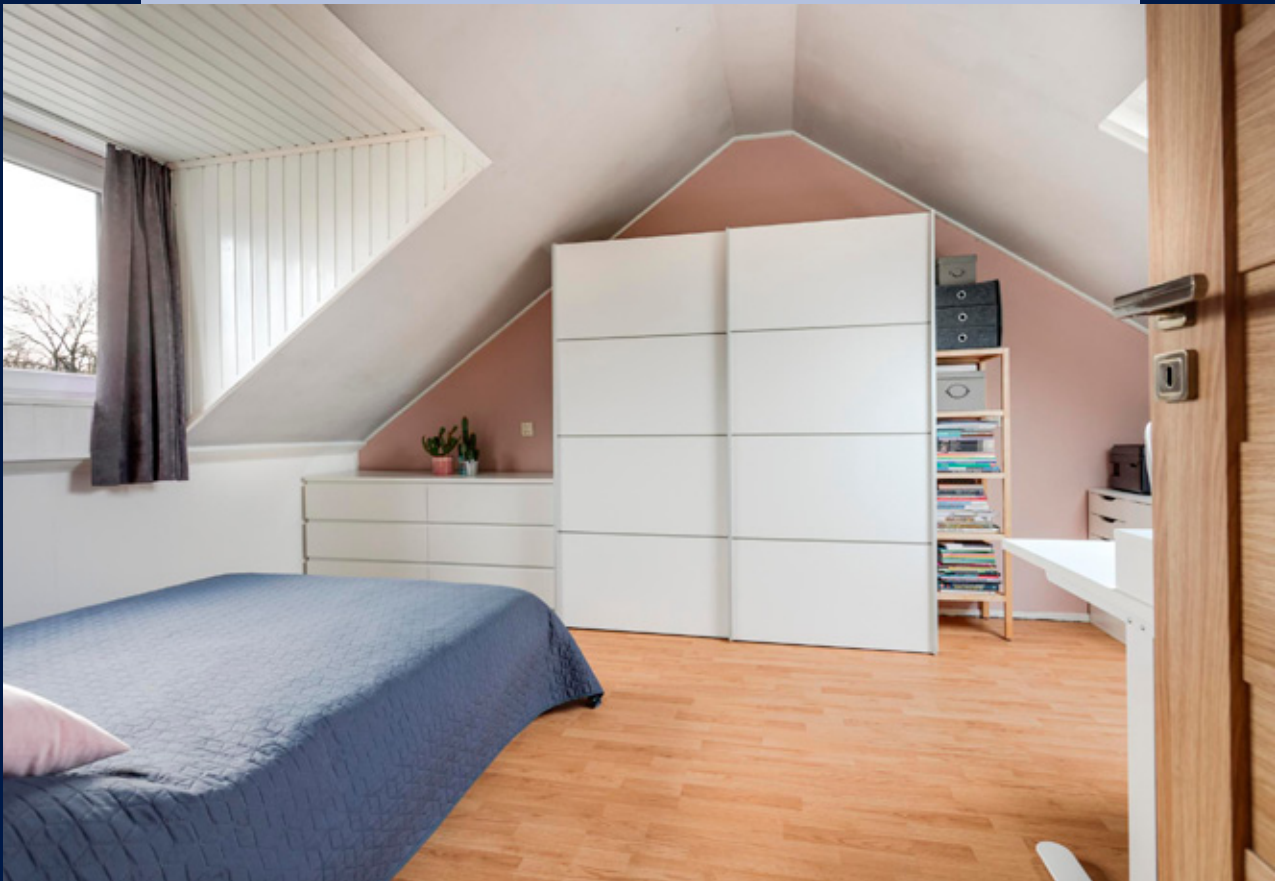
Eerste verdieping: overloop, twee in grootte variërende slaapkamers beide met dakkapel.