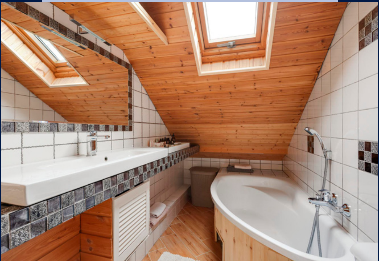
Eerste verdieping: tweede badkamer met ligbad, wastafel, tweede toilet en opstelling cv-ketel.