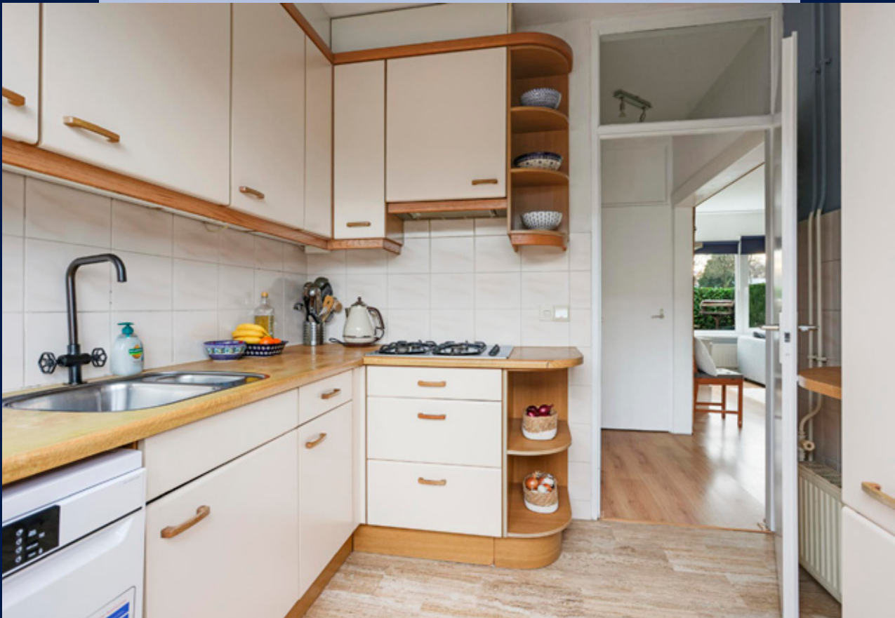
Dichte keuken met diverse inbouwapparatuur en deur naar de achtertuin.