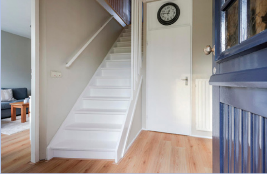
Begane grond: entree/ hal met meterkast en toilet.