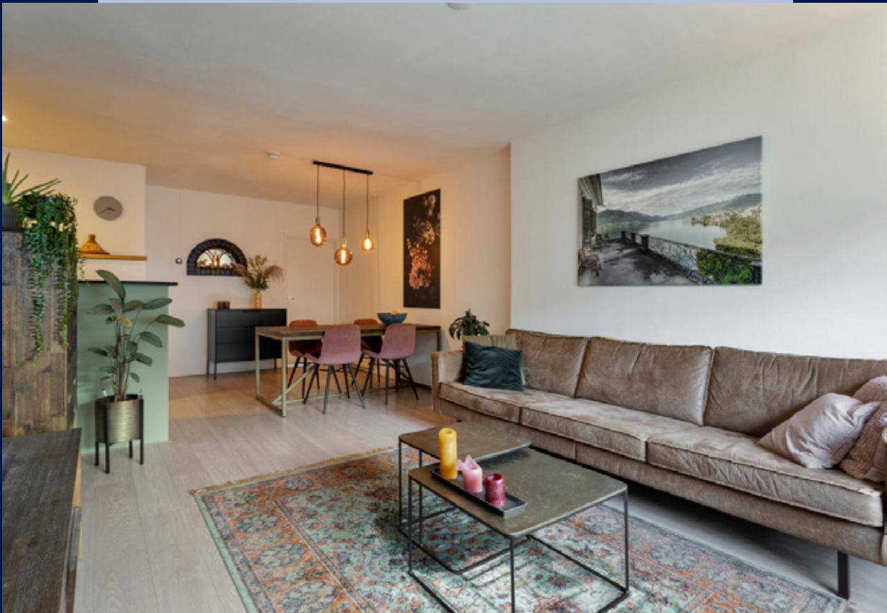
Ruime woonkamer met nette laminaatvloer.