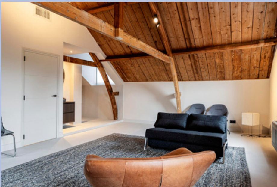
Twee slaapkamers zijn voorzien van een badkamer. Op de tweede verdieping zijn de authentieke balken bewaard gebleven.