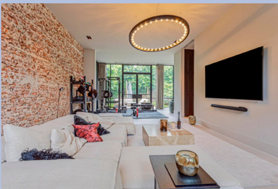
Een riante leefruimte op de begane grond welke is ingedeeld in een grote living met openslaande stalen deuren naar de tuin.