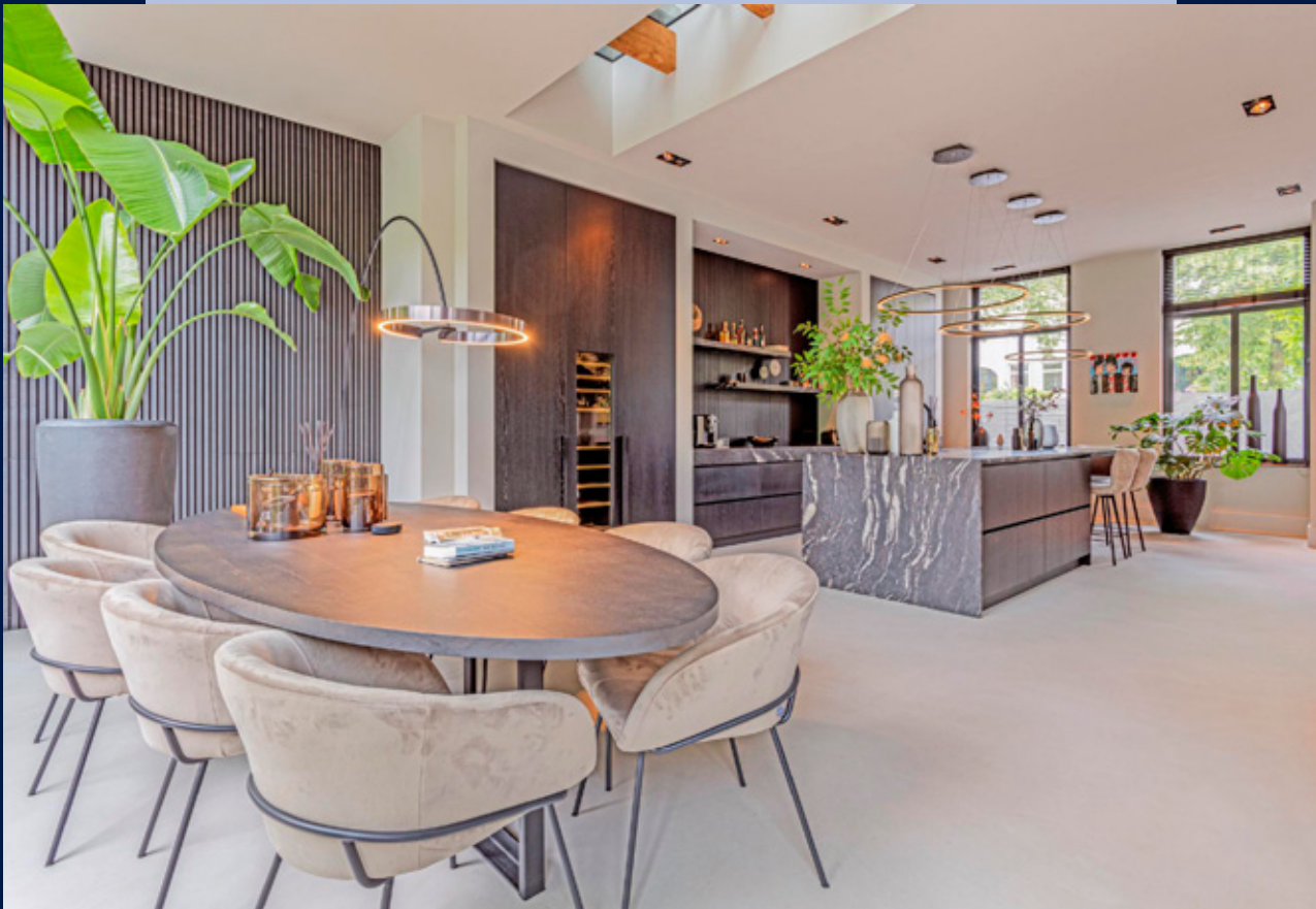
De woonkeuken is ingedeeld met een fraaie eetruimte richting de tuin.