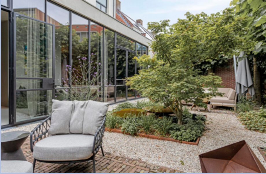
Fraaie, beschutte tuin gelegen op het zuidoosten met achterom.