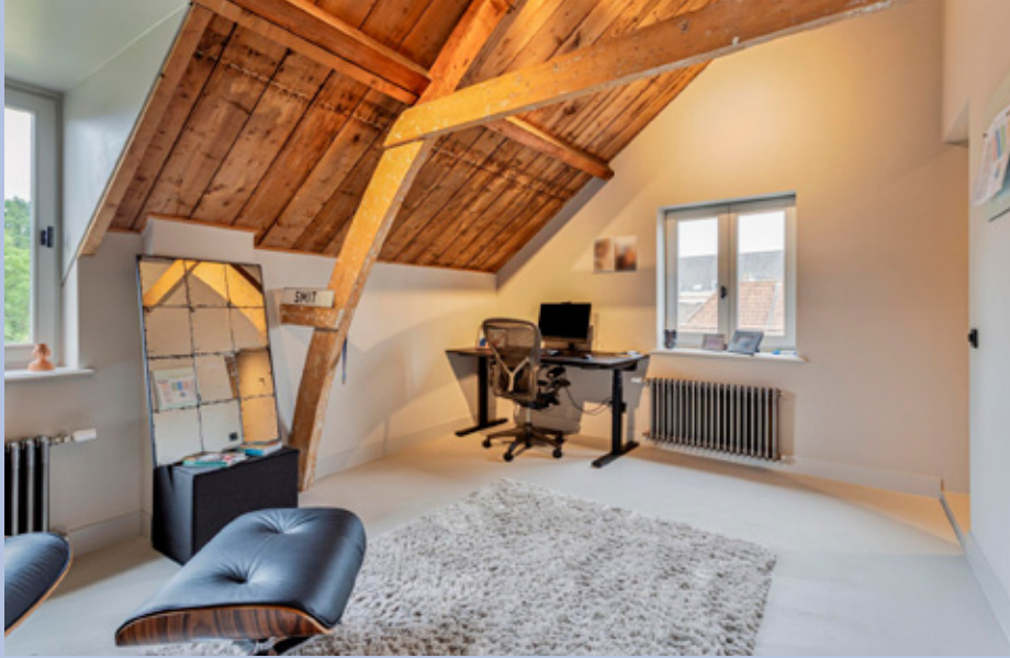
De tweede verdieping heeft drie slaapkamers, een wasruimte, stookruimte en een toilet.