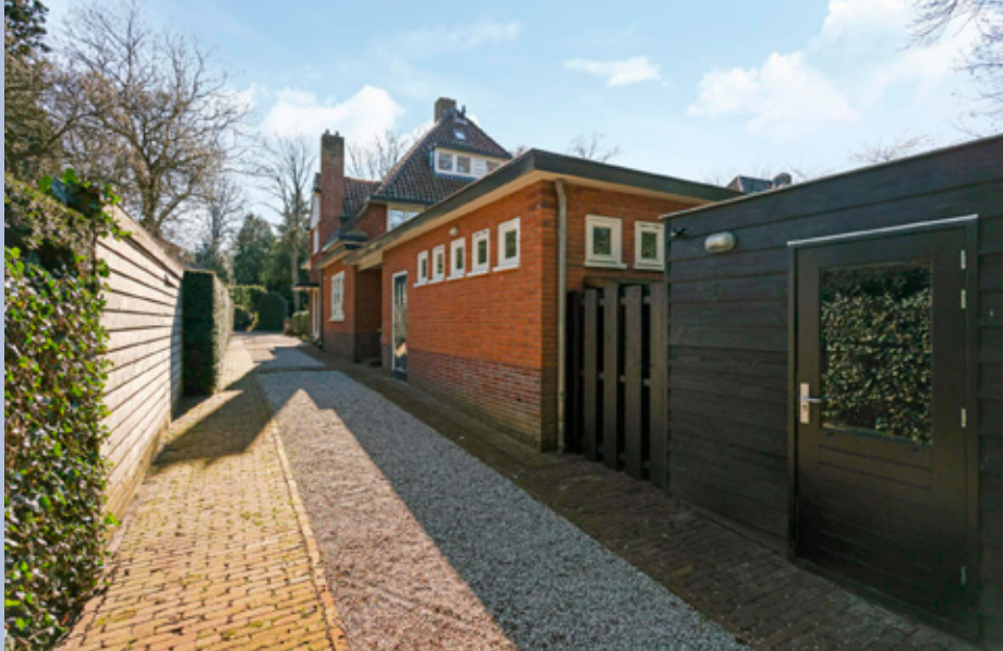
Er is ruimte voor meerdere auto's op de eigen oprit naast de woning.