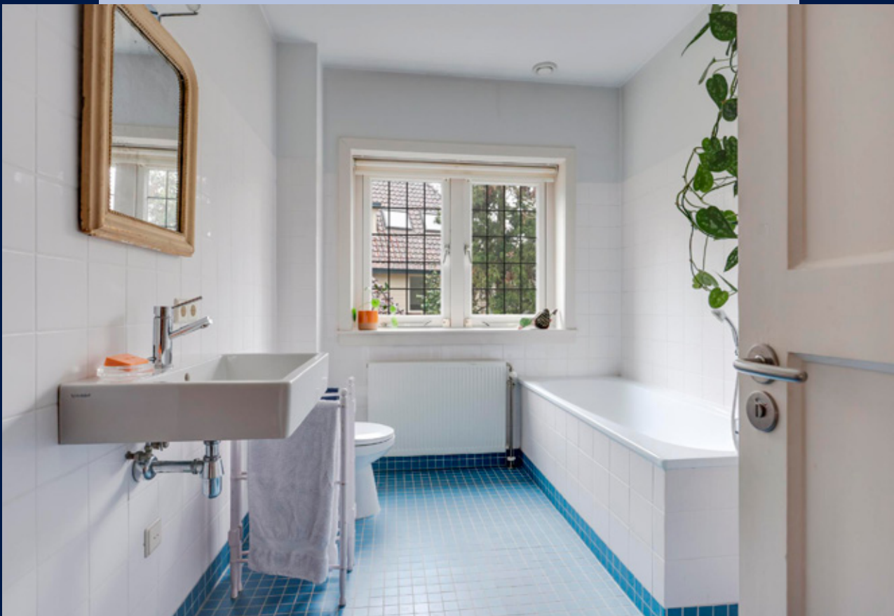
Tweede complete badkamer op de eerste verdieping.