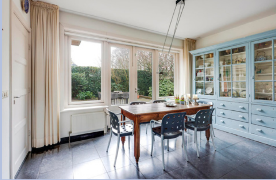
Vanuit de keuken is middels openslaande deuren de tuin toegankelijk.