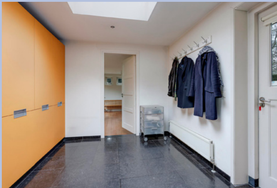
Achter de keuken bevindt zich de tweede entree met vaste kastenwand en een deur naar de tuin. Achterin de woning bevindt zich nog een kamer die momenteel dient als speel- en sportkamer.