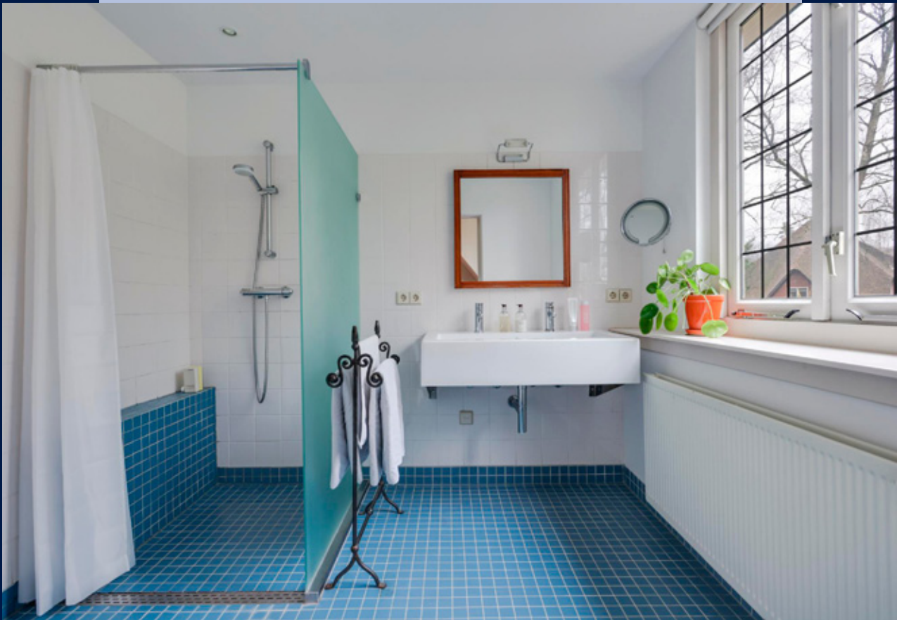
Badkamer aansluitend aan de master bedroom.