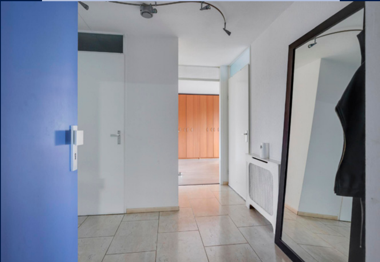
Woonetage: royale entree/hal, toilet met fonteintje, meterkast en praktische wasruimte met aansluiting voor wasmachine/droger en opstelling cv-ketel.