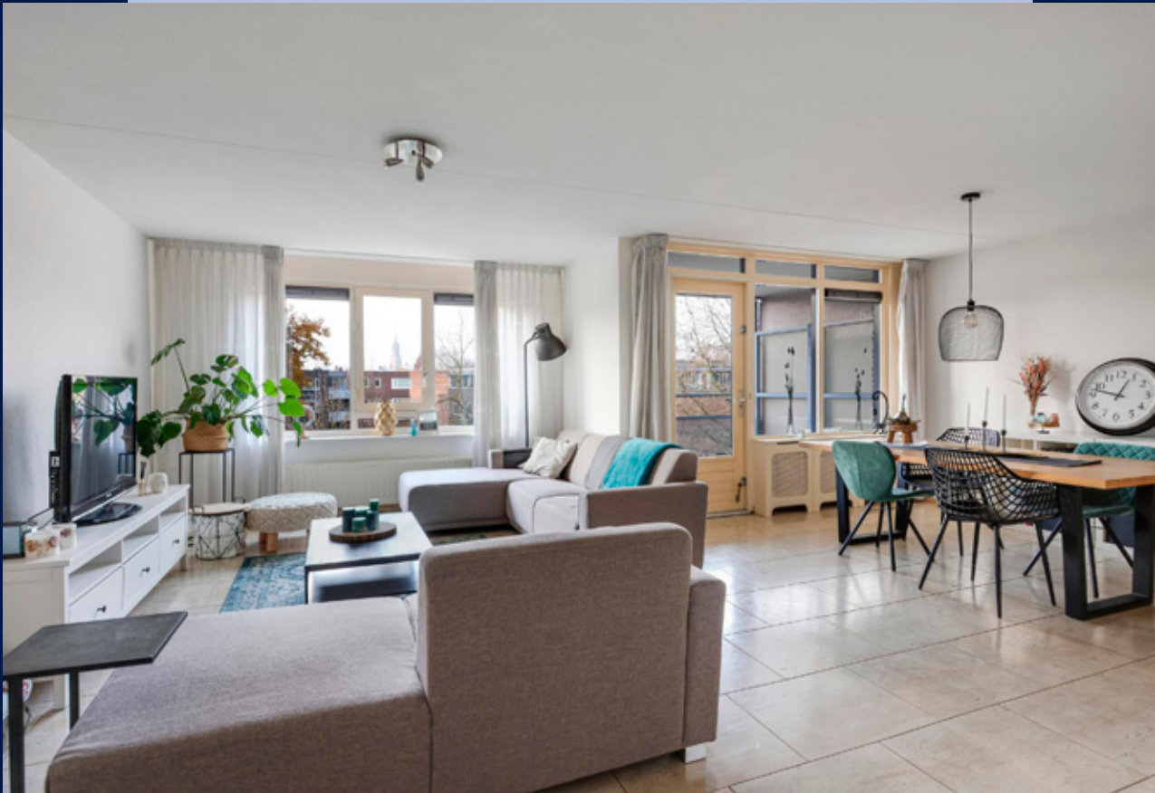
De royale en lichte woonkamer is voorzien van grote ramen met een fraai uitzicht over de omgeving en de Onze Lieve Vrouwetoren.