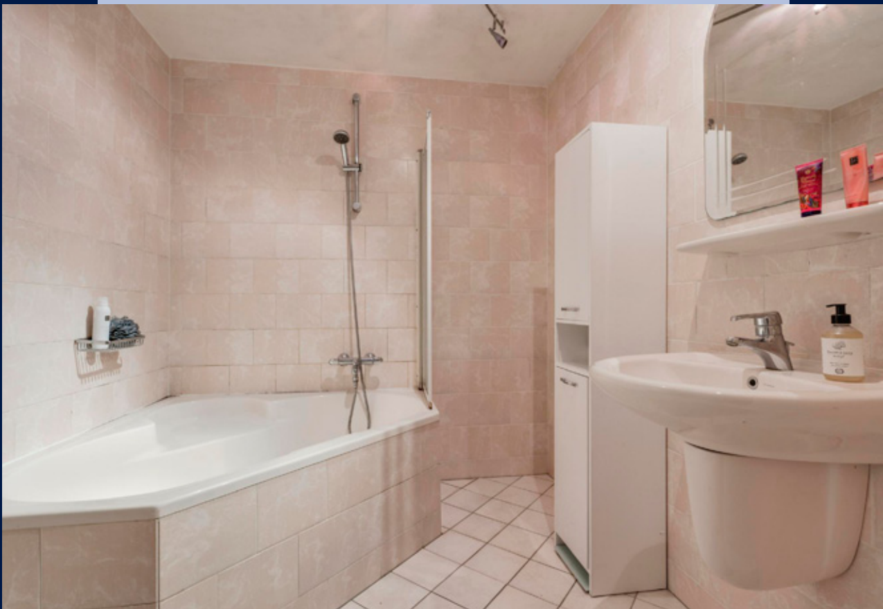
De badkamer is voorzien van een hoek bad met douchegelegenheid en een wastafel.