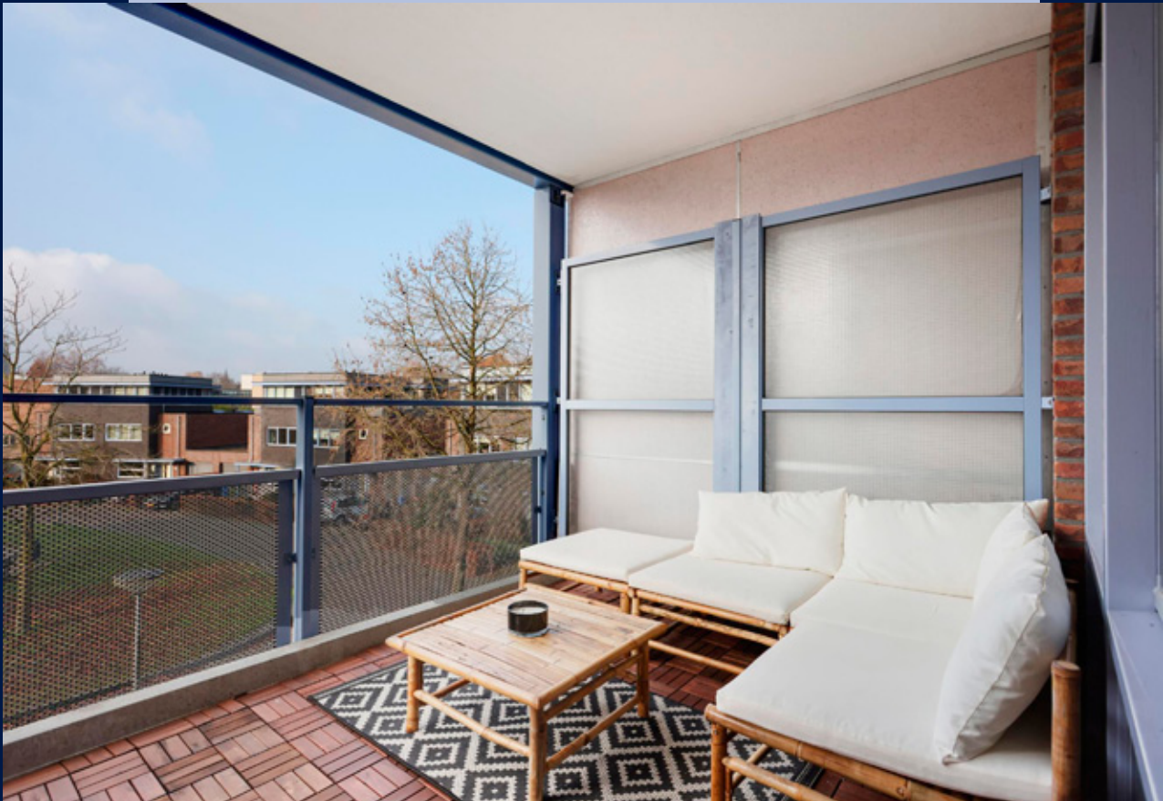
Vanuit de woonkamer is het balkon te bereiken.