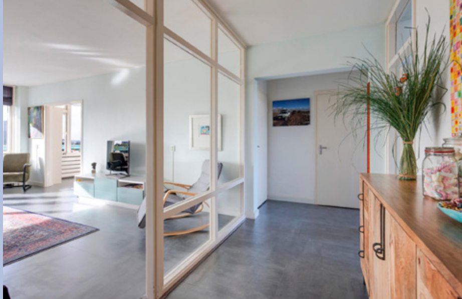
Ruime entree/hal met toegang tot een separate toiletruimte.