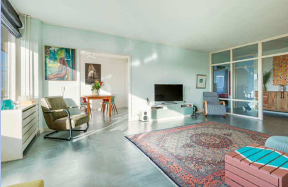
De royale en lichte woonkamer met aparte (eet)kamer is voorzien van een laminaatvloer en heeft toegang tot het balkon gelegen op het zonnige zuiden.