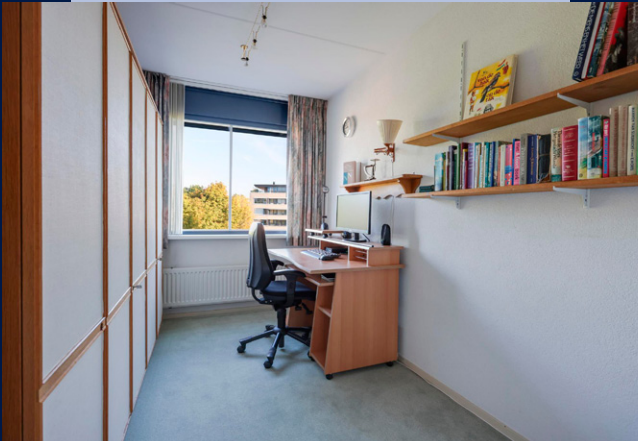
De andere slaapkamer is thans in gebruik als werkkamer.