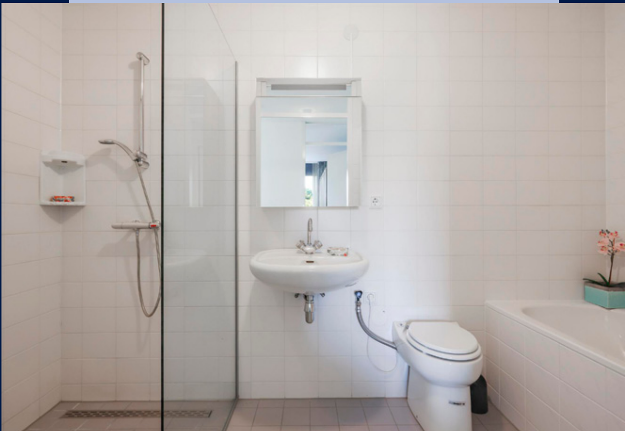
Badkamer in lichte kleurstelling met daarin een bad, een inlopdouche, een wastafel en een toilet.