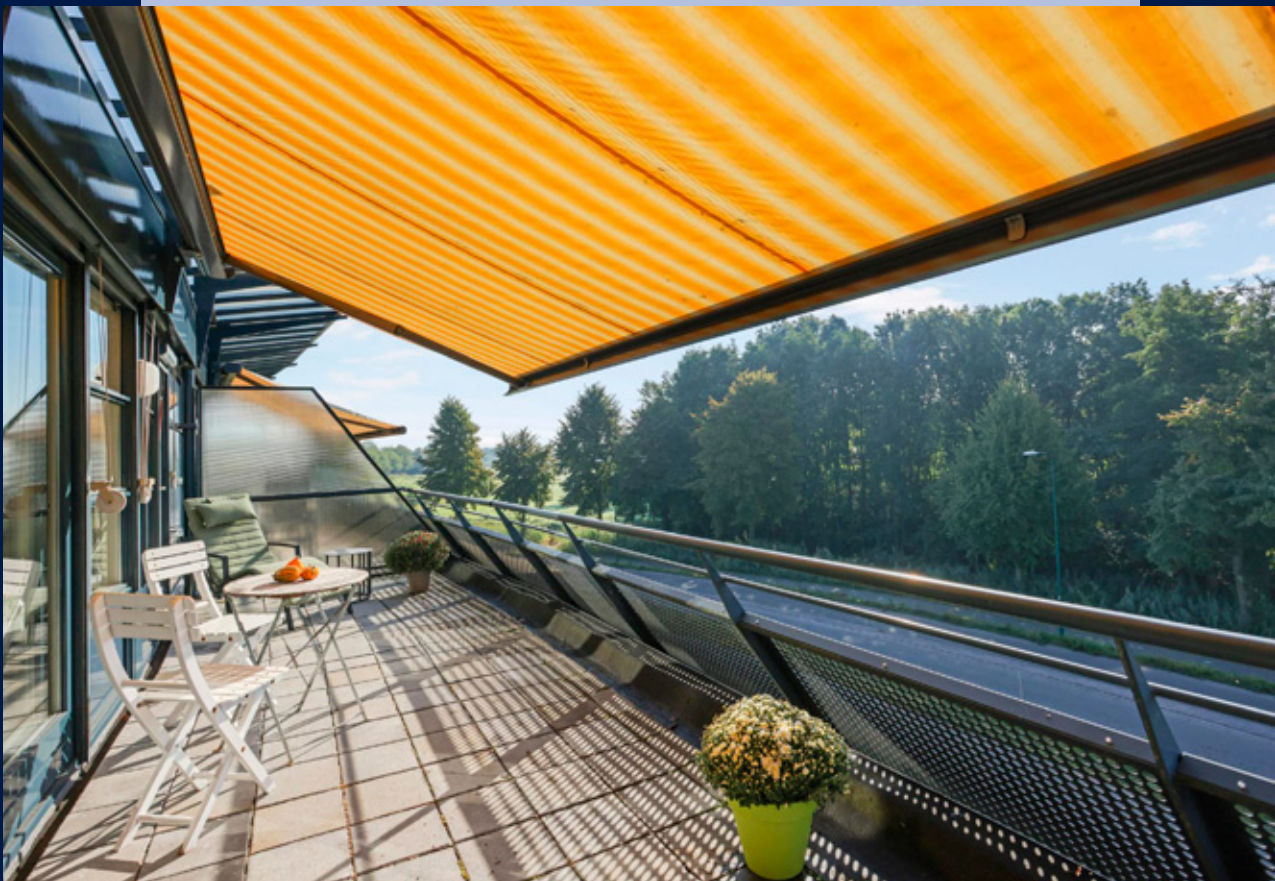
Het balkon is te bereiken door middel van een schuifpui en een deur en ligt over de volle breedte van de woonkamer.