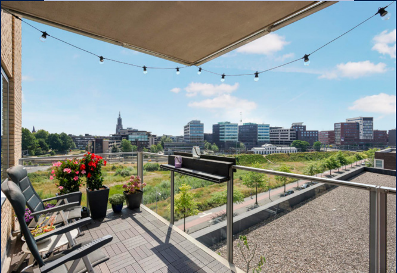
Beide balkons bieden een prachtig weids uitzicht over het stadscentrum en de "Onze Lieve Vrouwetoren"!