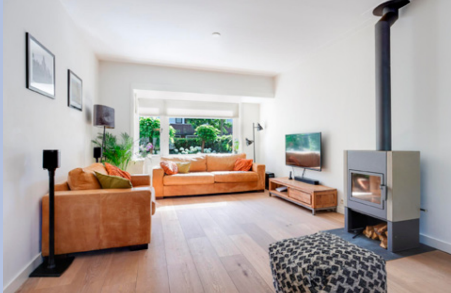
Royale, lichte woonkamer met openhaard en veel lichtinval.