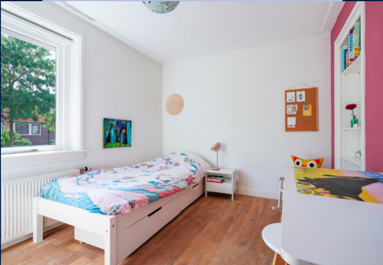
De slaapkamers voorzien van houten vloerdelen en strak afgewerkte muren.