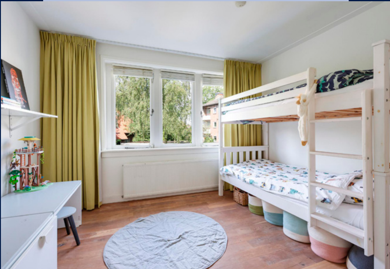
De slaapkamer aan de achterzijde is voorzien van vaste kasten.