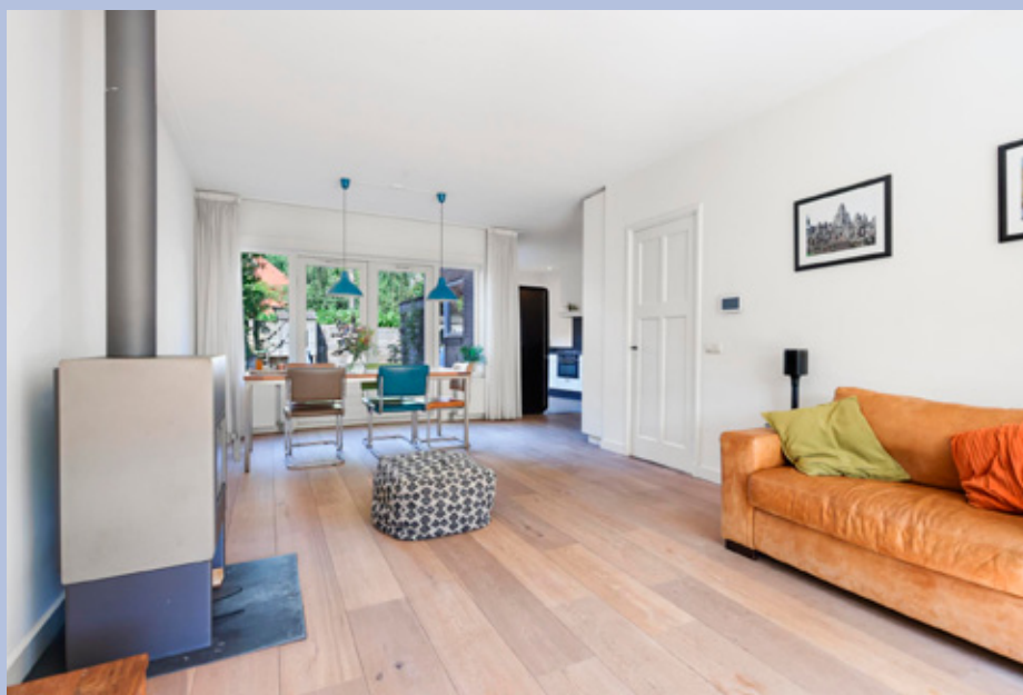
De woonkamer heeft aan de voorzijde een gezellige zithoek met erker en aan de achterzijde is de eetkamer gelegen. Middels openslaande deuren is er toegang tot de tuin. De woonkamer is afgewerkt middels strak stucwerk en een houten vloer.