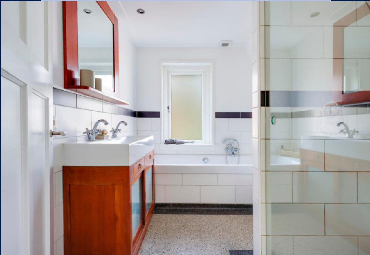
De badkamer in lichte kleurstelling beschikt over een ligbad, inlopdouche, wastafelmeubel en een toilet.