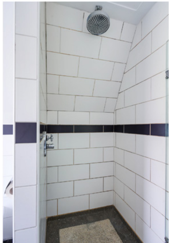
Evenals de keuken en hal is de badkamer afgewerkt met een terrazzovloer.